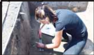
Z podlahy bývalé sklářské dílny odebrali mnoho skleněných vzorků.