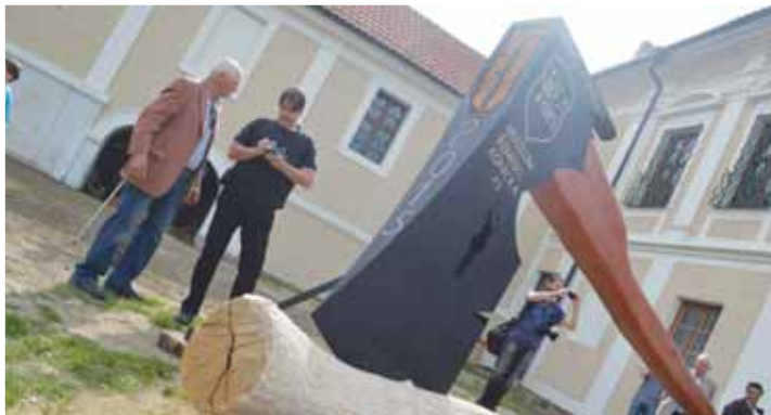
Největší sekeru v České republice, která své místo našla před vchodem do místního zámku, je skutečnou ozdobou města Konice.

Hlasovat v krajské anketě můžete už jen do poloviny srpna