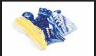
Archeologové objevili tyto a mnohé další skleněné předměty.