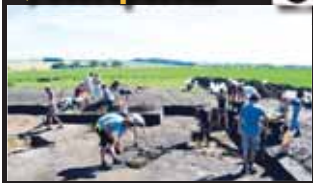
Letos poprvé se archeologové pustili do jeho důkladnějšího odkrývání.