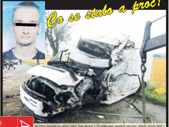
Hrůznou havárii na silnici mezi Seloutkami a Prostějovem nepřežil minulou středu mladý řidič z Určic. Jde o třetí tragickou nehodu na Prostějovsku v tomto roce.