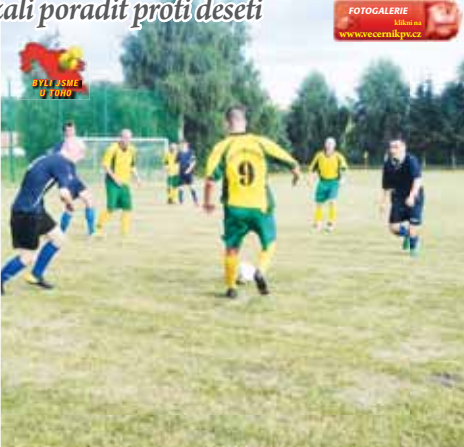
Jak dokazuje tato momentka, hosté z Nezamyslic si své tři body v úvodním dějství okresního přeboru doslova vybojovali.

se dostal Přikrylovi, který viděl vyběhnutého Simandla a dokázal ho přehodit zcela přesně – 0:1. Zbývající minuty první půle si dokázaly Nezamyslice hlídat a domácí vypadali jako opaření. Ve druhé půli se dal očekávat tlak domácích a zatažená obrana hostů, což se také naplnilo. Do plných se však Plumlovu vůbec nedařilo dostat. Hosté hráli chytré a nepouštěli domácí do ničeho. Po necelých dvaceti minutách hry se tak první šance dostal hostující Dvořák. Jeho hlavička však letěla jen těsně nad branku Simandla. Přes velkou herní převahu se domácí nedokázali dostat do vyzložených šancí. Dvacet pět minut před koncem se proto rozhodl vzít zakončení na sebe Fajstl z pětadvaceti metrů a přízemní prudkou střelou na zadní tyč nedal brankáři příšší šanci – 1:1. To domácí hodně nakoplo a o minutu později mohlo být skóre otočeno. Jenže Fajstl nespěl tváří brankáři a Čarný už se k dorážce nedokázal. Územní převaha pak byla domácími zcela k ničemu. Deset minut před koncem přišel od hostů blesek z čistého