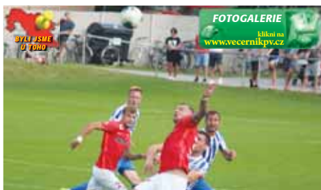
Obrana Prostějova tentokrát pracovala skvěle: soupeři nedávala zejména ve druhé půli téměř žádný prostor.

Už ve 4. minutě střelil zpoza vápna Kopriva, mimo. Na druhé straně tentýž hráč srazil soupeře, byla z toho nebezpečná standardka Zavadila, nakonec si ale domácí obrana poradila. Pak 14. minuta přinesla další standardku kapitána Brna. Po ní střelil z úhlu Přichystal, ale místo v brance netrefil. Právě Přichystal byl velice aktivní ve vápně, hlavou však centrované balóny nezachytával. I Prostějov se ale připomínal. Bartolomeu nákopem hledal na druhé tyči spoluhráče, nenašel. Pak ale přišla první tuťovka zápasu: Hosté zbytečně zahráli do autu. Po rychlém vhození se do rychlosti dostal Koudelka, který praudkou ranou provedl Floder. Ten skvěle zasáhl. Dobrou šanci měl následně i Kopriva, rána z voleje však byla sražená. Následovalo časté přelévání hry, ošvem bez větších šancí. Až 29. minuta přinesla protitlak při sražení Koprivou na trávník, hosté se však neradovali. Ke konci poločasu naopak šance začaly přicházet. Rezníček z úhlu střelil do gólmána, Koudelka pak vybil Kušeje ke skórování, ten těsně minul. Kopriva pak páhl hodně mimo, ve 41. minutě už se však skóre změnilo. Jan Koudelka byl chvilku nepokrytý, díky rychlému přenesení hry na levou stranu měl spoustu místa. A využil ho skvěle: přízemní ránu umístil na druhou tyč - 1:0. Zkraje druhé půle mohli rozhodnout Kušeje. Kopriva nejprve zastavil útok soupeře a následně poslal míč na Kušeje, který byl v dobrém lobu využil praudkou střelou Filip