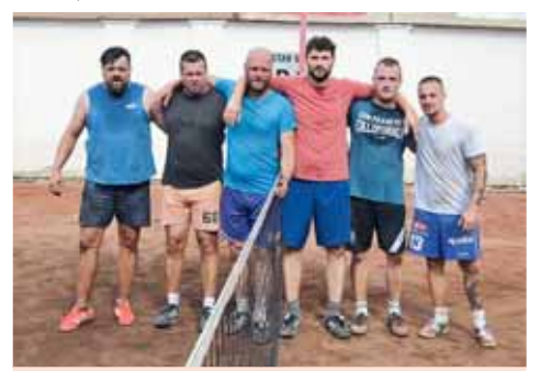
Finalisté Memoriálu Romana Oplockého a Petra Matkulčika na společném snímku.

statovat, že organizace, celkové zajištění i předvedená hra byly velice dobré. A šlo o další povedenou akci nohejbalového klubu TJ Sokol I Prostějov. Při této příležitosti musím poděkovat statutárnímu městu Prostějov, Olomouckému kraji a vedoucímu hospody na Bousíně za poskytnutou dotaci i věcný dar. Bez jejich pomoci bychom nemohli takhle kvalitní turnaj uspořádat“, zdůraznil Richard Beneš. (son)