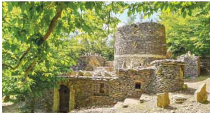
Romantickou napodobeninu zříceniny zámku vytvořil Zdeněk Procházka z Lipové, po němž nese Špacírštejn i své jméno.

Za vznikem a fungováním Muzea řemesel Konicka stojí další výrazná