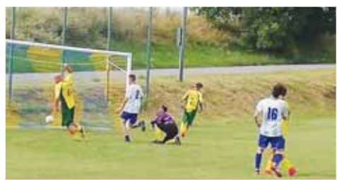
Z vítězství se radovali domácí.

nedají dohromady. Takže času na to, sehnat čtvrté mužstvo už opravdu nebylo a rozhodli jsme se změnit systém turnaje. Ale zase měl každý jistotu, že bude medailový,“ prozradil trenér domácích Michal Ročla. Oproti klasickému duelu se hrály všechny utkání, tedy dvakrát třicet minut. Turnaj tak místo ve dvanáct hodin začal až o půl druhé a v prvním souboji se utkaly Nezamyslice s Otaslavicemi. Vyrovnaný duel, který skončil po třech brankách na obou stranách, musely rozehodnout až penaltu. V nich byly úspěšnější „Metle“ a zapsaly tak první dva body. Porazené Nezamyslice čekal hned nato duel s domácími a zde už byla „Dobrátká“ lepší. Konečný výsledek 6:3 však hovoří o ofenzivní bitvě. Souboj o první místo se tak odehrál v posledním utkání, kdy se proti