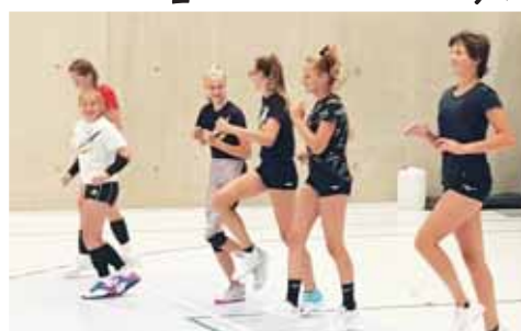
Rozvíčka žákyní VK Prostějov na jednom z prvních tréninků zahájené přípravy.

Přesně podle plánu naskočily do společného tréninkového procesu kadetky už v neděli 1. srpna, juniorky o den později a záložné od středy 4. srpna. Rovněž v jejich případě byly zahajovací dny týmové práce hlavně o nabírání kondice a méně o herních věcech.