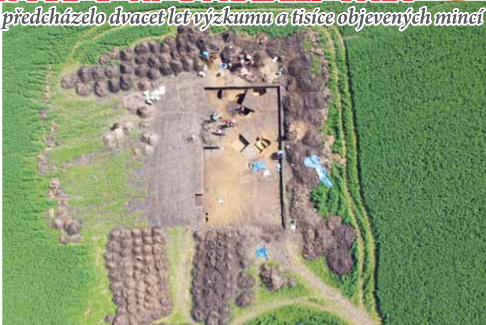
U Němčic nad Hanou se nachází jedno z nejvýznamnějších středoevropských archeologických nalezišť.

Málokdo tuší, že když vyjždí z Němčic nad Hanou ve směru na Prostějov, pak po své levé ruce máji prostor, kde to v minulosti neuvěřitelným způsobem žilo. Nacházelo se tu totiž jedno z největších a nejbohatších lidských sídel své doby u nás. Na poli ve směru na Víceměřice v lokalitě zvané Kratiny společně přebývaly zhruba mezi lety 300 až 120 před našim letopočtem tisíce Kelty. Jedno z nejdůležitějších center leželo přímo na hlavní větví tzv. Jantarové