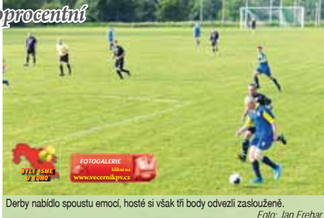
Derby nabídlo spoustu emocí, hosté si však tři body odvezli zaslouženě.

poslal na opačnou stranu - 0:1. Jen o chvíli později to bylo o dvě branky. Dlouhý míč za obranu skočil před velkým vápnem, svezl se po mokřem trávníku a přiskočil brankář Grulich, který už pak marně stíhal Pavla Plisku při jeho tažení vstříc prázdné bráně - 0:2. Poslední minutu prvního poločasu už větší vstřížení nenabídl. Do druhé půle se snažili domácí vstoupit aktivněji, a ještě s výsledkem něco udelat. Stále však diváci sledovali více faulů a ostrých soubojů než šancí. První vážnější akce přišla po zhruba deseti minutách, kdy si Vávra udelal prostor po kraji a dostal se až ke střele, kterou vyšetřil Grulich. Snaha domácích ke snížení vedla pouze ke střele Pošpísla, který však potřebnou přesnost nenašel. V polovině druhé půle tak přišel třetí direkt pro domácí. Po rohovém kopu se míč odrazil k Vávrovi, který viděl, že domácí brankář gestikuluje s útočníkem, a poslal míč jednoduše do branky. Jelikož nikdo z arbitů nepískal žádný faul, byl tento gól téměř do prázdné branky uznán - 0:3.