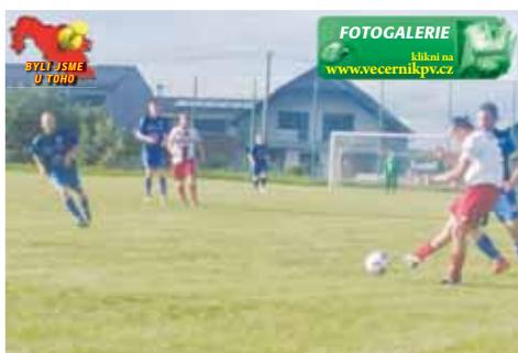
Luká byla po celých devadesát minut lepším mužstvem.

Hned z první akce se radovala hostující družina z branky. Jenže gólové hlavičce předcházel ofsajd, na který upozornil sám hostující pomezní. Luká však i nadále byla daleko lepší na míči a dokázala soupeře zatlačit. Zdětín ale začal velmi dobře zezadu a kromě první akce si své území hlídal. O prvním vážnějším ohrožení se dalo mluvit v desáté minutě, kdy Motlův centr z trestného kopu našel hlavu Pluháčka, ale ten branku nenašel. O chvíli později se hosté branky dočkali. Špatného obranného zákroku po centru z levé strany využil Kvapil, ke kterému se míč odrazil, a z první propalil přízemní střelou brankáře Šimka – 0:1. 1 další minuty patřily Luká. Jenže ji zastavoval nepřesné zakončení, případně se ani do finální fáze nedostala. Místo navýšení náskoku se tak mohli do zápasu dostat domácí. K odraženému míči se hnál Adam, jeho pokus z dobré vzdálenosti míč nenašel ani síť za brankou. Druhý branky se hosté ještě v první půli dočkali. Po dobrém rohovém kopu se nejlépe zorientoval Muzikant a míč dokázal dostat až za brankovou. Tam ho sice chytil domácí brankář, ale ani on proti verdiktu sudího neprotestoval – 0:2. Hned poté sudí odpískal konec první půle. Druhá pětáctiminutovka začala tam, kde skončila první. Hosté byli