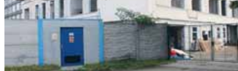
U Galy se sice skutečně pracuje, stavba se však omezuje výhradně na objekt bývalé jídelny, o jejím dalším rozšíření na pětipatrový dům o 50 bytch zatím nemůže být řeč.