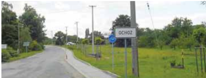
Nepronjete. Takový vřkaz řidiči od správců a majitelů silnic viděli na Prostějovsku během léta velmi často.

O něco lépe se od bude jezdit řidičům v okolí Laškova. Nejpозději 31. srpna totiž končí hned tři objízdky, které soferům komplikovaly život. Přímou z Laškova už se lidé do Konice dostanou snáz, stejně tak z Pěncína. A také silnice II. třídy mezi Laškovem a Novou Dědinou je hotová. „Úsek Nová Dědina-Kandia je dodělán. Ale v Laškově je pořád uzavírka, zde ještě pokračujeme