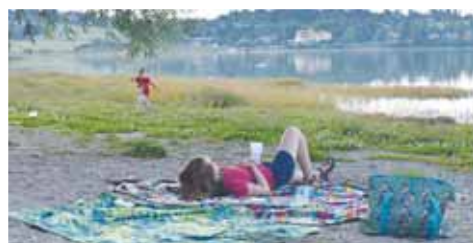
Koupací sezóna je, zdá se, u konce. Smutného konce...

Konec srpna a začátek září? Podle meteorologů deštivé, chmurné počasí. Což znamená mnoho věcí. A jednou z nich je, že koupaliště nejspíše osuší. Třeba ta přírodní. Platí to zejména o plumlovské sezóně, která právě takto završí nepříliš povedený ročník. Nejenže větší část léta propršela a srpen byl navíc místy opravdu chladný, ale v nádrži navíc chyběla voda a od