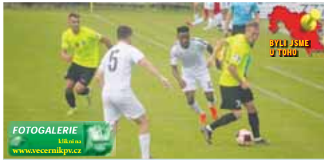
FOTOGALERIE Klikni na www.vecernikpv.cz

Prohrát 0:4 už se Prostějovu letos jednou „podařilo“. A sice se Spartou Praha „B“. V utkání však měl tým šance, náznaky a zároveň pořádný kopec smůly, když si dva míče srazili nešťastně obránci do vlastní brány. Duel s Vyškovem, ač výsledkově stejný, však působil úplně jinak. „Taky jsem jako trenér prohrál ve Vyškově, 3:6 to bylo. Padli jsme v poločase 0:5, ale pak dali na 2:5, 3:6. Měli jsme dvě břevna, zápas mohl skončit 5:6. To se stát může. Ale co jsme předvedli od první do poslední minuty, to jsem nezažil,“ hromoval dále Jura. Mínil tím rychlost, bojovnost, ale také počet šancí, Prostějov neměl z vápna ani jednu. A zahazoval i nečetné standardní situace.