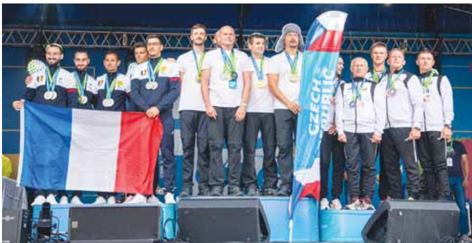
Tým ČR triumfoval mezi družstvy na přesnost přistání i absolutně.

Dukla předvedla nejúspěšnější šampionát v historii, z Ruska přivezli čtyři zlata, dvě stříbra a jeden bronz