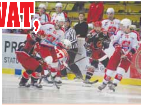
Kadr Jestřábů je uzavřen. Tým navíc může být s dosavadním průběhem přípravy spokojený.

Konec přípravy znamená také poslední kosmetické změny v týmu.