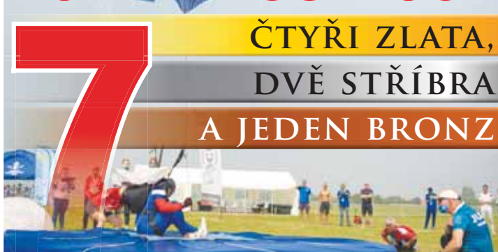
Parašutisté ASO Dukla Prostějov skákali na MS v Rusku skvěle.