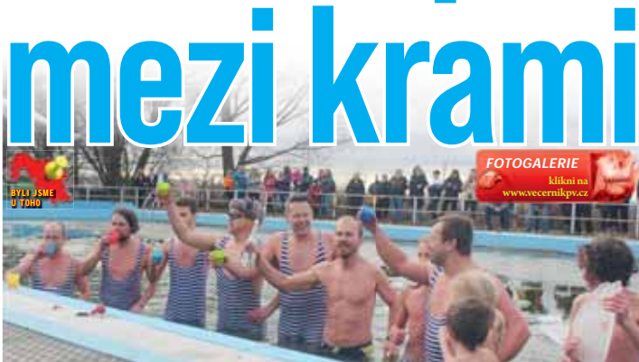
Mažoretů si i letos se svými kamarády a dětmi připili na zdraví ve vodách bazénu koupaliště v Nezamyslicích.

Spolek Nezamyslických mažoretů měl tentokrát opravdu co slavit, ostatně právě v uplynulém roce se jim podařilo v městyši otevřít vlastní nabřeží. Další akce by měly následovat, nelze například vyloučit, že koncem školního roku se bude v jejich režii konat již třetí poslední ročník Zimní olympiády.