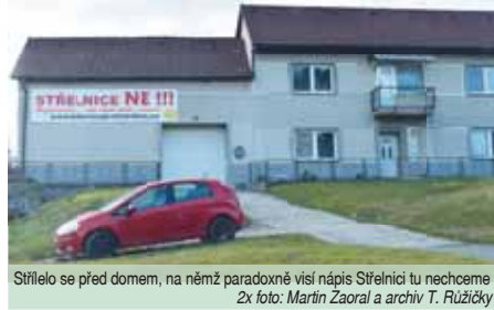
Střílelo se před domem, na němž paradoxně visí nápis Střelnice tu nechceme

Navzdory přímým svědkům střelec, který byl v minulosti usvědčen z pytláctví, celou záležitost popíral. Případ tedy musela vyšetřit policie, jež usmrčeného praseta v hodnotě 7 000 korun vyhodnotila jako přestupek proti majetku. Přes skutečnost, že ke střelbě došlo pravděpodobně nelegálně drženou zbraní na veřejně přístupném místě, se na kvalifikaci dle našich informací zřejmě nic nezměnilo.