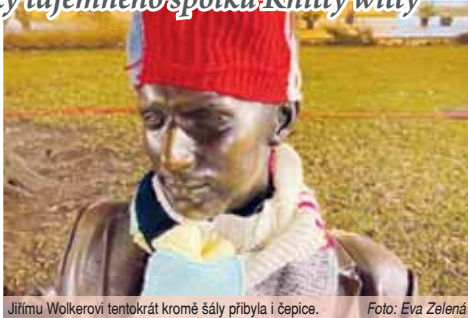
Jiřímu Wolkerovi tentokrát kromě šály přibyla i čepice.

Zahalení sochy nese podtitul „ošleňní“ Jiřího Wolкера. „Začali jsme s tím ve stejném roce, kdy byla socha slavnostně odhalena. Už je to pro nás taková vánoční tradice. Letos byla změna minimálně v tom, že šálu ani čepici nikdo nevezl už během první noci. Možná za tím stojí omezení vánočních trhů,“ pousmála se