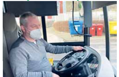
Řidiči autobusů mají také povinnost mít nasazené respirátory. Jeden ze šoferů prostějovské MHD to ale podle stížnosti občana vůbec nedodržuje.