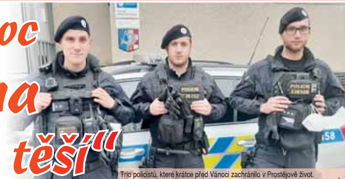
Trio policistů, které krátce před Vánoci zachránilo v Prostějově život.