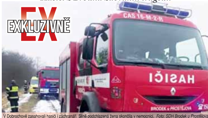
V Dobrochově zasahovali hasiči i záchranáři. Silně podchlazená žena skončila v nemocnici.

DOBROCHOV Dramatické chvíle se odehrály v úterý krátce po poledni nedaleko obce Dobrochov. Postarší paní byla na procházce se svým psem a následkem pádu skončila v potoce. Jak se dostala do úžlabí, které je dva metry pod úrovní terénu, zatím není jasné. Žena měla štěstí, že ji objevily náhodně kolemjdoucí, které okamžitě zavolaly pomoc.