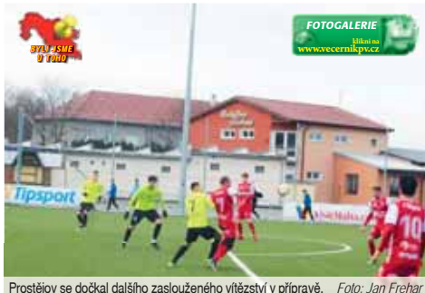
Prostějov se dočkal dalšího zasluženého vítězství v přípravě.