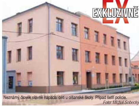
Neznámý člověk slovně napadal děti u olšanské školy. Případ šetří policie.