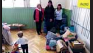
Spousta neprodaného oblečení a dětské výbavy putovala z Prostějova na Ukrajinu.