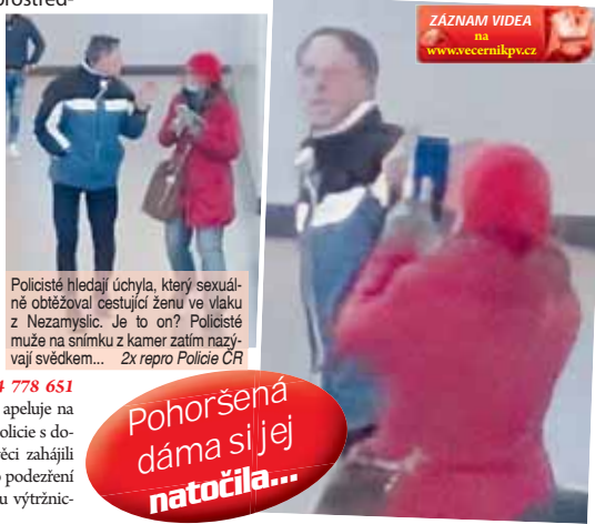
Policisté hledají úchyla, který sexuální obtěžoval cestující ženu ve vlaku z Nezamyslic. Je to on? Policisté muže na snímku z kamer zatím nazývají svědkem...

Prosíme o sdělení jakýchkoliv informací, které by vedly k jeho ztotožnění na bezplatnou linku 158 nebo na telefon 974 778 651 případně 974 778 688, “ apeluje na veřejnost mluvčí krajské policie s dodatkem, že policisté ve věci zahájili úkony trestního řízení pro podezření ze spáchání trestného činu výtržnictví.