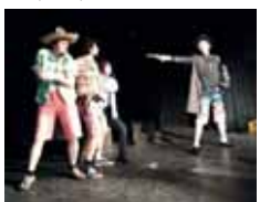
Divadlo Point představilo v sobotu večer reprízu hry Miluju svůj mobil .

PROSTĚJOV Představení Divadla Point uplynulou sobotu večer zcela vyprodalo útlé hlediště ve svém hájemství ve školní budově na Husově náměstí. A to i přesto, že k vidění byla už několikátá repríza hry Miluju svůj mobil .