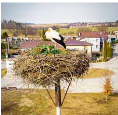
Ze svého hnízda v Bohuslavicích má krásný výhled po okolním kraji.

na ostatní hnízda. „V tom, kdy přesně ptáci přiletou, hraje velkou roli skutečnost, odkud se vrací“, vysvětlil již dříve pro Večerník ornitolog Tomáš Opločský. (mls)