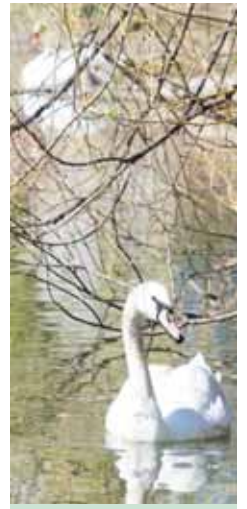
Nový labutí pár se na rybníku krátce objevil už po úhynu samice v roce 2020. Následně se však po něm slehla zem.

2022 Ovdovělému samci se konečně podařilo najít novou partnerku, kterou si přivedl opět na rybník.