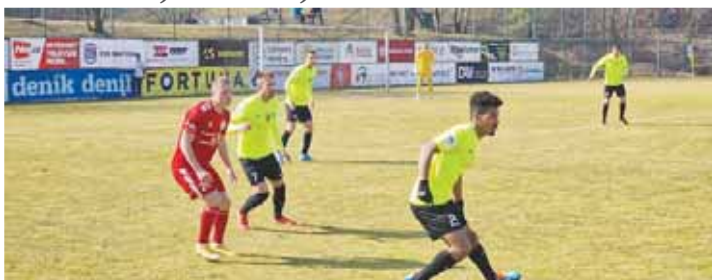
Na půdě zachraňujícího se Třince se nikdo neprosadil.