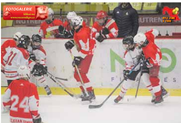
V souboji s Opavou starší žáci dominovali.