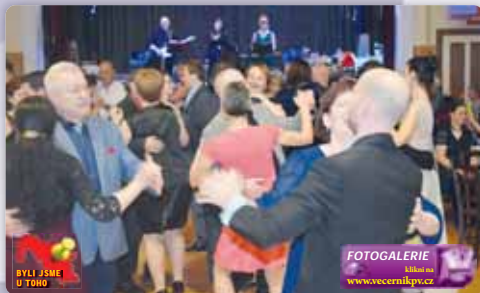
BYL JSEM U TOHO

Epidemie covid-19 výrazně v uplynulých dvou letech zasáhla do plánů všech organizátorů kulturních a společenských akcí v Kralicích na Hané. Letošní obecní ples