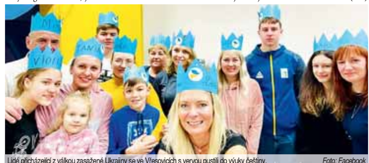
Lidé přicházející z válkou zasažené Ukrajiny se ve Vřesovicích s vervou pustili do výuky češtiny.

Jak Večerník zjistil, ukrajinské děti chodí i do dalších základních škol, na příklad do ZŠ Jana Železného v Prostějově. (mls)