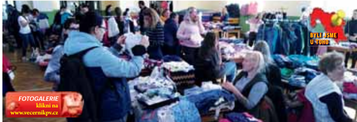
Tělocvična prostějovské sokolovny byla předminulou nedělí dopoledne zcela zaplněná maminkami, které prodávaly dětské zboží. Část nabízených věcí poputuje na Ukrajinu.

stějovské maminky nabízely za velmi nízké ceny nejen obnošené dětské oblečení nejrůznějšího druhu, ale také boty, kočárky, hračky a další věci, které už nepotřebují. „Tato akce už probíhá spoustu let a jsem ráda, že ji osobně mohu podpořit a tradičně nad dětským bazárkem přebírám patronát.“