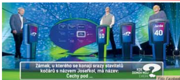
Zámek, u kterého se konají srazy stavitelů kočárů s názvem Josefkol, má název: Čechy pod ...