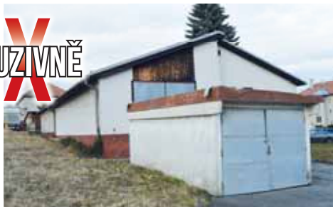
Tento objekt bývalého obchodu nedávno koupila společnost, za kterou vystupuje Kateřina Koldová. Zřejmě i na tomto místě bude chít nabízet další byty.