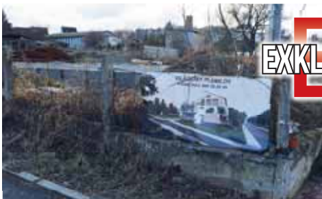
Na tomto místě v Plumlově měl už koncem uplynulého roku stát bytový dům v hodnotě výrazně přesahující 50 milionů korun.