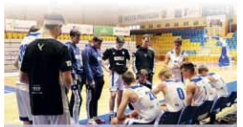
Tým kadetů BCM Orli během oddechového času jednoho ze zápasů.

Na Snakes Ostrava ztrácejí propašných šest výher. „Musíme se dívat na situaci