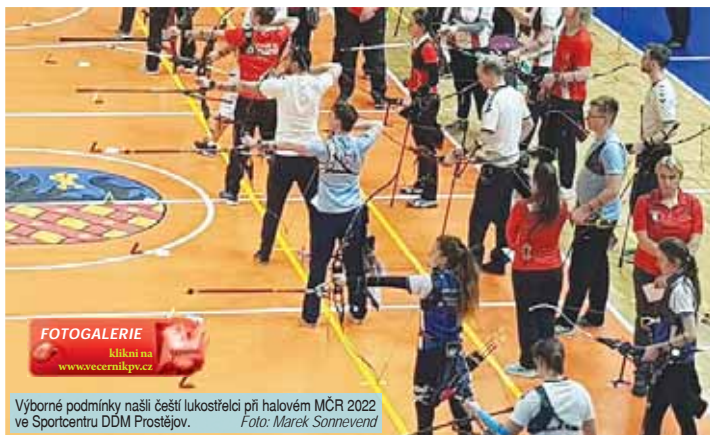
Výborné podmínky naši českí lukostřelci při halovém MČR 2022 ve Sportcentru DDM Prostějov.