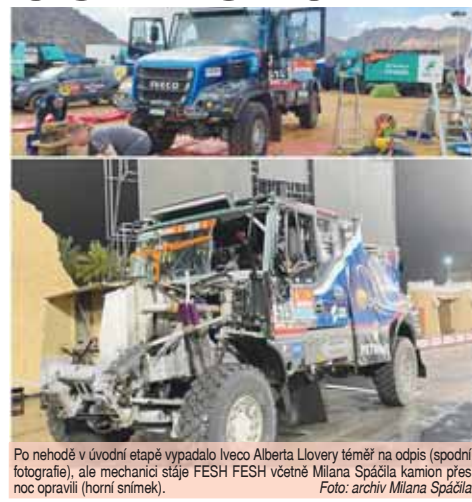
Po nehodě v úvodní etapě vypadlo Iveco Alberta Llovery téměř na odpis (spodní fotografie), ale mechanici stáje FESH FESH včetně Milana Spáčila kamion přes noc opravili (horní snímek).