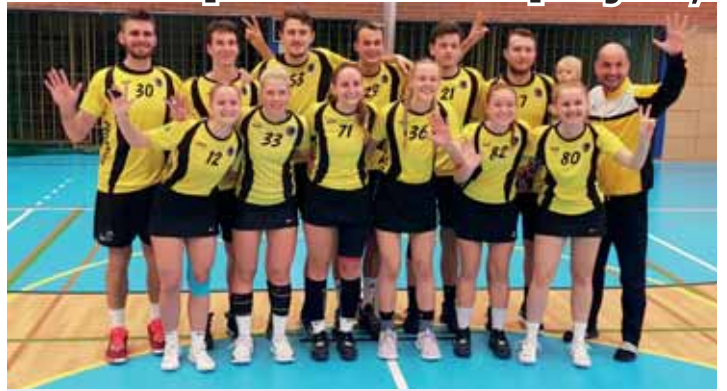
Získají korfbalisté SK RG Prostějov první mistrovský titul v klubové historii?

Příprava SK na soudný střet se odvíjí ve standardním režimu normálních tréninků, ovšem s jednou výjimkou.