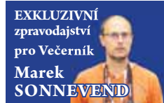
EXKLUZIVNÍ zpravodajství pro Večerník Marek SONNEVEND

PROSTĚJOV Korfbalistkám a korfbalistům SK RG Prostějov nastává velký DEN D. Už tuto sobotu 26. března odpoledne sehraji v domácím prostředí haly RG a ZŠ Otto Wichterleho ve Studentské ulici finálové zápasy jak extraligy, tak 1. ligy ČR 2021/2022 dospělé kategorie. Obě střetnutí jsou součástí takzvaného Finálového dne českého korfbalu, jehož se hanácký klub stal pro letošek organizátorem. A oba týmy pořádacího oddílu samozřejmě touží na vlastním hřišti vybojovat zlaté medaile!