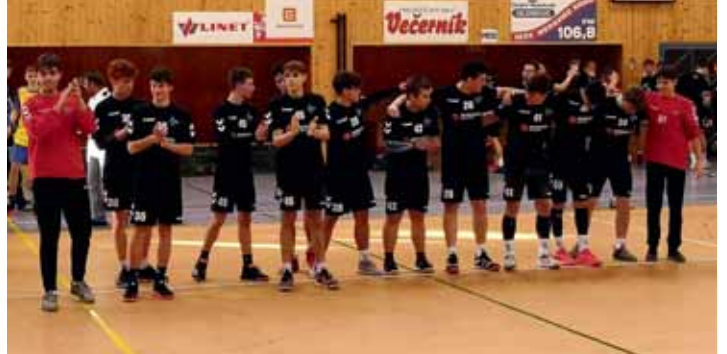
Mladším dorostencům Házenkářské akademie Olomouckého kraje se v nejvyšší české soutěži zatím daří skvěle.

PROSTĚJOV Mládežníkem Házenkářské akademie Olomouckého kraje i TJ Sokol Centrum Haná skončila základní část jejich soutěže 2021/22, na řadu okamžitě přichází fáze nadstavbová. Pojdme se podívat, jak si talentovaní házenkáři obou klubů z prostějovského regionu zatím vedou. Nejlépe jsou na tom mladší dorostenci HAOLK, kteří v 1. lize (nejvyšší soutěž ČR) obsadili vy-