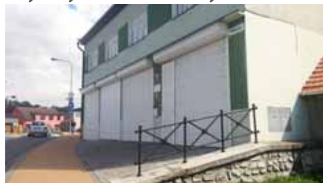
Po výstavbě nové hasičské zbrojnice na okraji města, slouží ta stará ve středu města potřebám zdejších dobrovolných hasičů.

Ve dvou malých obecních bytech na sídlišti Sport už první březnovou nedělí ubytovali dvě ukrajinské maminky. I zde se o zabydlení prostor postarali dobří lidé z Kostelce na Hané. „Jedná se o sestry. První z nich obývá garsonku se svými dvěma dospívajícími dětmi, druhá je pak v bytě 1+1 se čtyřmi dětmi. Dostaly se k nám na základě osobního kontaktu s prostějovskou Charitou. Obě si již dokonce o nás našly zaměstná-