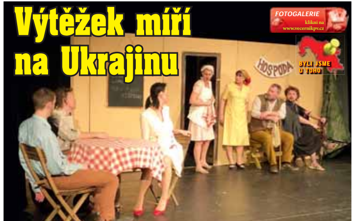
Pohádka o sedlákově, který se upsal čertu, pobavila i poučila.

Pohádka vyprávěla o mazaném sedláku Čuperovi, který se upsal čertovi. A jak to, že byl mazaný? Ono totiž, když někdo nechce udělat, co se po něm vyžaduje, obvyčejně to odbude tím, že řekne