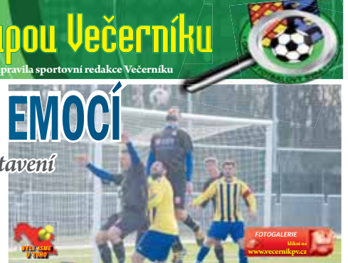
Boj o míč, nejčastější úkaz v zápase Vícova s Dobromilicemi.

Domácí byli aktivnější, dostávali se do náznaků šancí. Při akci Plisky byl opět zapískán ofsajd. Krátce poté si Pagáč vykoledoval přímý kop. Ten se ale příliš nepovedl. Další minuty se odehrávaly v duchu hádanie Neděly s jedním z diváků. Ve 22. minutě pak byli diváci svědci první šance hostů, Richter ale po autu mířil mimo. Pak zápas sklouzl znovu k hádkám, tentokrát mezi Nedelou a domácím kapitánem.