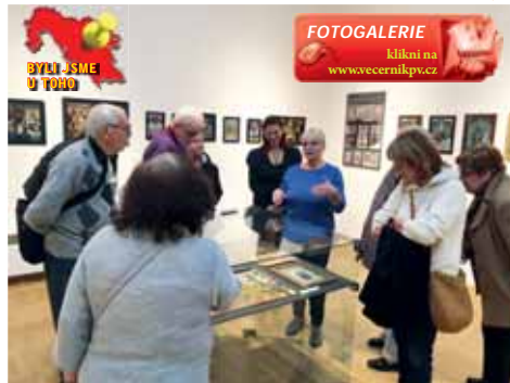
Poslední komentovaná prohlídka skleněných podmaleb přilákala deset zájemců.

Lidové obrazy na skle jsou jednou z nejsvráznějších forem výtvarného umění v lidovém prostředí zejména v 19. století. Podmalby na skle byly vytvořené speciální technikou malby za studena, kdy se barevná vrstva nanášela z rubové strany. To znamená, že obrazy nepotřebují závěrečnou fixaci. Jde ale o náročnou techniku. Postup malování je obrácený. První se malují na sklo detaily, například