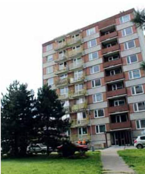
Na městské ubytovně v Kostelecké ulici bydlí už šestnáct Ukrajinců z řad uprchlíků.

„Připravujeme tělocvičnu na Vápenici i halu Sportcentra,“ prozradil první náměstek primátora Jiří Pospíšil