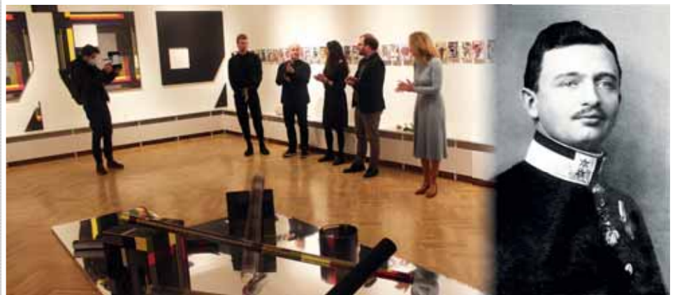
Letošní rok se v Muzeu kočárů v Čechách pod Kosířem ponese v znamení posledního českého krále Karla I.