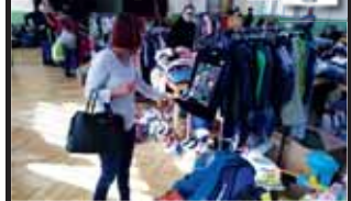
V sokolovně utrácela peníze také Milada Sokolová, koupila oblečení pro syna.