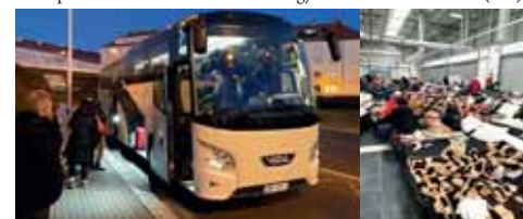
Autobus vypravený z Prostějova odvezl 51 ukrajinských uprchlíků z polské Korčavy do České republiky. Pohled na uprchlické centrum, kde přespává až čtyři tisíce uprchlíků, není pro slabé povahy...