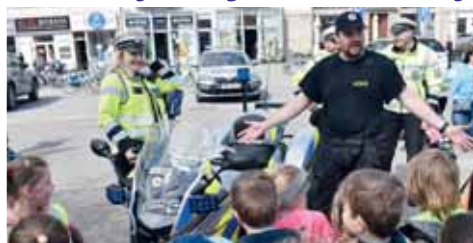
Prostějovské náměstí v pátek dopoledne obsadily složky IZS, aby zde předvedly svoji techniku, výzbroj či výstroj. Nejoblíbenější byla snad policejní motorka.

I tak ale diváci, a v dřívější většině děti z prostějovských základních škol, se měli na co dívat. Svoji běžnou činnost zde prezentovali policisté, kteří se vyznali s motorkami i speciálními vozidly dopravního inspektorátu, strážníci zákona byli taktéž v obležení zejména malých chlapců u stanovišť, kteří předváděli svoji výzbroj a výstroj. Strážníci městské policie zase předvedli, jak se odchyťávají zatoulaní pejsáci, děti si mohly nasadit brýle simulující