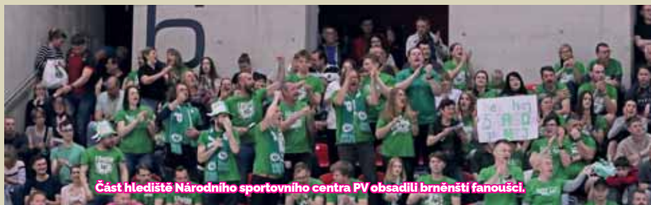
Část hlediště Národního sportovního centra PV obsadili brněnští fanoušci.