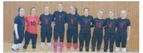
Volejbalistkám TJ OP Prostějov se povedlo udržet druholigovou soutěž.

Na závěr tak jeho svěřenkyně svedly přímou bitvu o klíčovou druhou pozici pro-