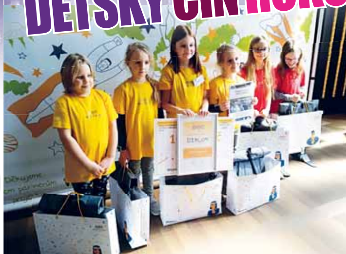
Žáci z Prostějova si v Praze převzali celou řadu hodnotných dárek, a to za sestavení kuchařky, kterou již představili přímo na Staroměstské radnici v Praze.

Díky celému projektu si děti v uplynulém týdnu převzaly nejen spoustu krásných cen od společnosti Whirpool a dalších partnerů projektu, ale v Praze se také podívaly do muzeí čokolády a voskových figurín. Také se objevily ve vysílání dětského programu Děčko, což pro ně byla také nezapomenutelná zkušenost. Otázkou zůstává, co bude s knižkou Nejlepší recepty našich babiček dál. „Už chystáme její slavnostní předání v Centru sociálních služeb. Vše to