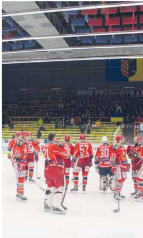
Z týmu, který v Prostějově udělal velký semifinálový úspěch, už odešlo šest hráčů.

5. zápas: Kladno – Jihlava 6:3 (2:2, 1:1, 3:0). Branky: 6. Zikmund (Dotchin, Bow), 18. A. Kubík (Baránek, Hlava), 20. M. Beran (Plekane, A. Kubík), 55. M. Beran (Zikmund, Plekane), 55. Plekane (Hlava), 60. A. Kubík – 12. F. Seman (Holt, Kachyňa), 16. Čachotský (Menšík, T. Harkabus), 39. F. Seman. Konečný stav série: 4:1, Kladno udrželo extraligu.