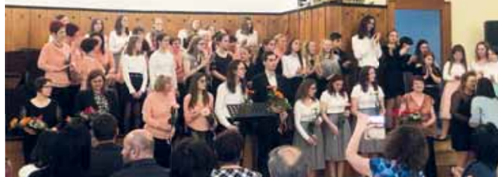
Při společných písních se sboristé tak tak vešli na pódium.