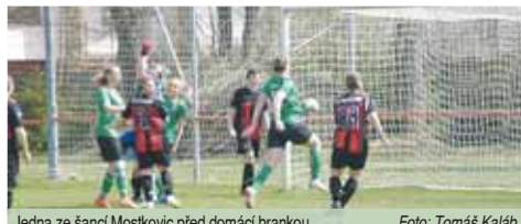
Jedna ze šancí Mostkovic před domácí brankou.

●● Přestože jste měly po celý zápas více ze hry? „Jelikož šlo o derby, soupeřky jsou na nás více nahacované. A myslím si, že holky si ten jeden bod taky zaslouží. Samozřejmě že jsme mohly vyhrát, ale na druhou stranu, jak jsme si říkali, taky prohrát, takže remíza 2:2 je v tomto zápase ideální.“