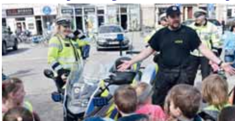
Prostějovské náměstí v pátek dopoledne obsadily složky IZS, aby zde předvedly svoji techniku, výzbroj či výstroj. Nejoblíbenější byla snad policejní motorka.