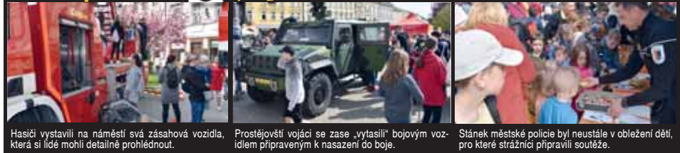
Hasiči vystavili na náměstí svá zásahová vozidla, Prostějovští vojáci se zase „vytasilí“ bojovým vozidlem připraveným k nasazení do boje. Stánek městské policie byl neustále v obležení dětí, pro které strážníci připravili soutěže.