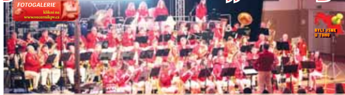
V hale Suprovka se konal sobotní koncert LŠU z Němčic nad Hanou.