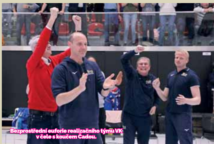
Bezprostřední euforie realizačního týmu VK v čele s koučem Cadou.