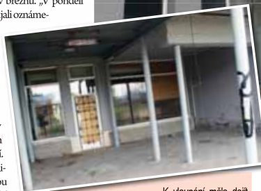
K vzloupání mělo dojít z prostoru od zchátralého fotbalového stadionu, v jehož blízkosti se zdržují bezdomovci.

Policiisté vzloupání potvrdili, dojit k němu mělo už v březnu. „V pondělí 21. března jsme přijali oznámení o vniknutí do objektu u tenisových kurtů ve Sportovní ulici v Prostějově. Neznámý pachatel se do objektu vzloupal někdy mezi 7. lednem a dnem oznámení. Po rozbítí okna vnikl dovnitř a celou budovu prohledal. Z vnitřních prostor po jeho odchodu zmizely umyvadlové a sprchové baterie, byly ukradeny čtyři stoly, třiatřicet židlí a tři stojany s výčepní pipou, plechové