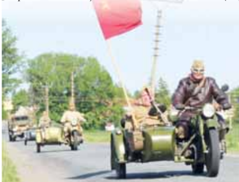
Prostějovští fandové vojenské historie zatím naposledy brázдили regionální silnice v roce 2019.

To byl ostatně i důvod, proč KVH Dukla přenechala organizaci úspěšného zářijového Dobývání Plumlova na tamním zámku jiným pořadatelům. (mls)