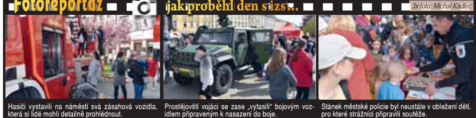
Hasiči vystavili na náměstí svá zásahová vozidla, Prostějovští vojáci se zase „vytasilí“ bojovým vozidlem připraveným k nasazení do boje. Stánek městské policie byl neustále v obležení dětí, pro které strážníci připravili soutěže.

Bud' jak bud', pátéční Den s integrovaným záchranným systémem se na prostějovském náměstí náramně vydařil, o čemž svědčí i obrovská účast návštěvníků.