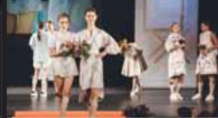
Krása dívek i květin k sobě velmi dobře ladila.