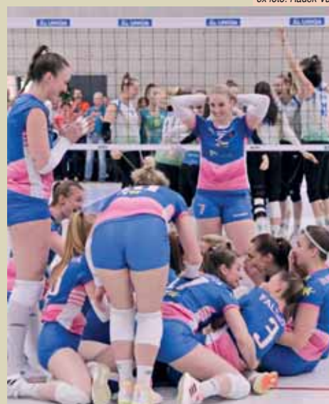
Momenty největšího štěstí Hanaček po úplně poslední výměně bitvy.