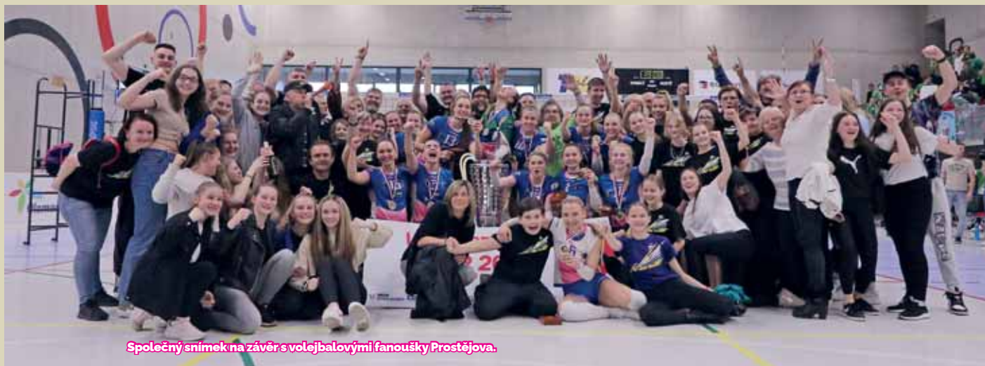
Společný snímek na závěr s volejbalovými fanoušky Prostějova.