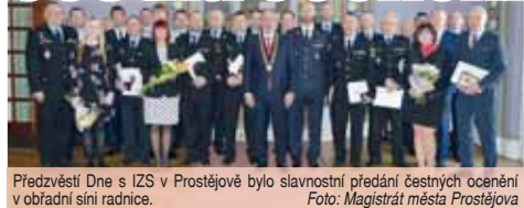
Předvéstí Dne s IZS v Prostějově bylo slavnostní předání čestných ocenění v obřadní síni radnice.

PROSTĚJOV Pátéční Den s integrovaným záchranným systémem měl slavnostní začátek v obřadní síni prostějovské radnice. Zastupitelstvem schválené osobnosti byly vyznamenány čestnými oceněními. Ta převzali policisté, strážníci, hasiči, komunální politici a další lidé, kteří se podíleli na spolupráci s IZS v Prostějově.