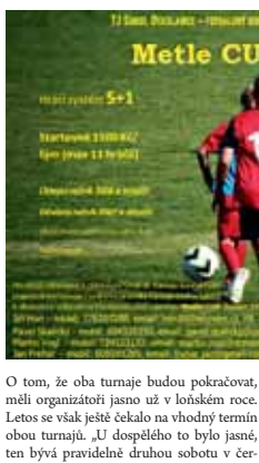
U toho, že oba turnaje budou pokračovat, měli organizátoři jasnou už v loňském roce. Letos se však ještě čekalo na vhodný termín obou turnajů. „U dospělých to bylo jasně, ten bývá pravidelně druhou sobotu v čer-

PROSTĚJOV Poslední dubňový týden potěšila fanoušky fotbalu dobrá zpráva. Stejně jako v předělních letech i letos okolení letní přestávku dva turnaje v Otavalskovicích. Ještě před prázdninami se 25. června o slovo nejprve přihlásí Metle Cup junior věnovaný žákovským kategoriím. O čtrnáct dní později 9. července na dělné naváže na specifických hřištích dalším ročníkem i soutěž pro dospělé fotbalisty Metle Cup.