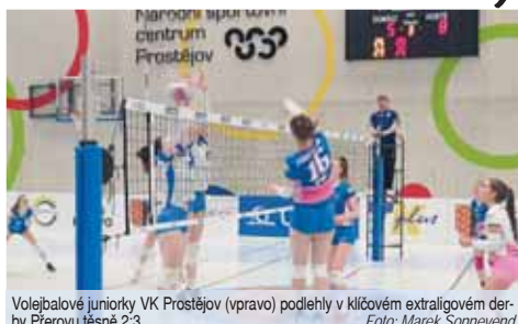
Volejbalové juniorky VK Prostějov (vpravo) podlehly v klíčovém extraligovém derby Přerovu těsně 2:3.

bojovným naladěním i solidním výkonem,“ ohlížel se hlavní trenér juniorského výběru věkáčka Zde-něk Sklenář.