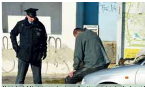
Viditelně opilý řidič odmítl policistům „dýchnout“ a při tom jim vulgárně nadával a urážel je.

Za Pěncínem směrem na Laškov u místního areálu se policejní autohlídce podařilo řidiče zastavit. Tím ale problém ani zdaleka neskončil. „Tam se muž pokusil za volantem vyměnit se svojí spolujezdkyní. Řidič z auta vystoupil a na výzvu k předložení dokladů nereagoval. Vozidlo obcházel velmi nejistým krokem a jevil známky podnapilosti. Opět se o dvěře spolujezdkyně. Hlídce pak poskytly své údaje. Dechové zkoušce se odmítl podrobit a nesouhlasil ani s převodem do nemocnice a odběrem biologického materiálu.