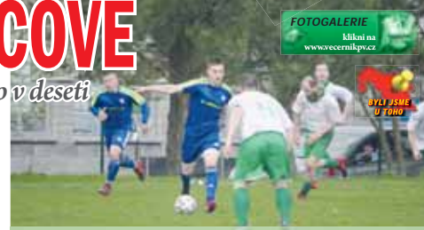
Vícov byl častěji na míči. Měl ale problém se dostávat přes pozornou obranu Ptení.

Vícov se ve druhé půli snažil snížit. Hned zkraje Rajnoha střel na pravou tyč, minul, tentýž hráč následně spálil i druhé tyčky šanci, byl ale sražen a následovala penalta. Tu poslal Vávra penou mimo dosah brankáře – 1:3. V 59. minutě se hostující Novák blyskl tím, že vstřílil do obou kombinací Vícova. Krátce nato byl v akci znovu aktivní Rajnoha, zakončením hrou ale nevstřílel, mohl tří tyče. Po hodině hry pak začaly naplo propukat na hřišti emoce. Ani jed-