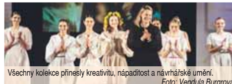
Všechny kolekce přinesly kreativitu, nápaditost a návrhářské umění.