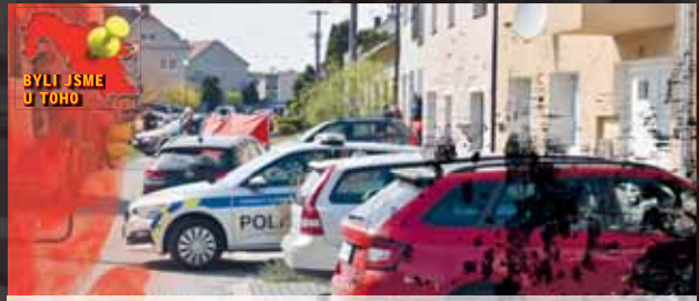
Zaparkovaná ulice v Kostelci neunikla pozornosti projíždějících řidičů. Jako první zde zasahovali policisté, kteří zabarádovaného pachatele museli zneškodnit.

KOSTelec NA HANÉ Rodinná tragédie, která nemá v celém regionu obdoby! Hned k trojnásobné vraždě došlo uplynulý pátek 29. dubna v ulici Přemyslovka v Kostelci na Hané. Zřejmě psychicky nemocného muže popadl amok a uvnitř domu údajně mačetou pozabíjel bratra a sestru. Na ulici pak stejným způsobem usmrtil i svého otce. Na místě činu jej zadrželi policisté, dle některých měl být při zásahu postřelen. Z početné rodiny kromě útočnicka přežila jediná dcera, která byla v tu dobu naštěstí ve škole. Podle místních se jeho bratr před časem oběsil, jeho maminka pak zhruba před třemi lety po vážné nemoci zemřela.