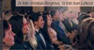
Sál Městského divadla v Prostějově byl nabitý diváky.