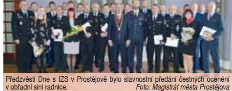
Předvéstí Dne s IZS v Prostějově bylo slavnostní předání čestných ocenění v obřadní síni radnice.

PROSTĚJOV Pátéční Den s integrovaným záchranným systémem měl slavnostní začátek v obřadní síni prostějovské radnice. Zastupitelstvem schválené osobnosti byly vyznamenány čestnými oceněními. Ta převzali policisté, strážníci, hasiči, komunální politici a další lidé, kteří se podíleli na spolupráci s IZS v Prostějově.