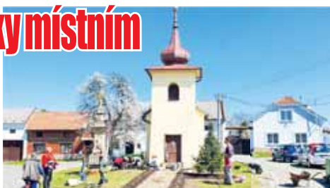
Do sázení se zapojilo zhruba 15 lidí.

Sešlo se při ní zhruba patnáct lidí, kteří společně přiložili ruce k dílu. Za zkrášlení Těšic všem dobrovolníkům moc děkujeme,“ vzkázal starosta Nezamyslic Vlastimil Michlíček. (mls)