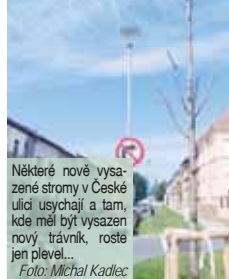
Některé nové vysazené stromy v České ulici usychají a tam, kde měl být vysazen nový trávník, rostou jen plevel...

PROSTĚJOV Vykácení jednatřiceti letitých lip v České ulici v Prostějově v březnu loňského roku vzbudilo obrovské rozhořčení nejen u obyvatel žijících v této lokalitě. Nádherné stromy musely padnout kvůli rekonstrukci vodovodního řadu. Vedení města přislíbilo okamžitě náhradní výsadbu, což se také stalo. Jenže... „Po vykácení stromů byly zasazeny nové, avšak některé už uschly. Dále pak trávníky byly upraveny jen po ulici Krátká, zbytek trávníků v ulici je v otřeseném stavu. Po navedení zeminy po stavbě vodovodu nelze tyto plochy označit jako trávník, jsou plně náletových rostlin, plevelu, a dokonce řepky,“ stěžoval si na magistrátu obyvatel České ulice. Odbor správy a údržby majetku města prostějovského magistrátu potvrdí