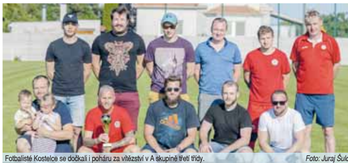
Fotbalisté Kostelce se dočkali i poháru za vítězství v A skupině třetí třídy.