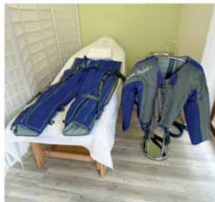
Lymfatické kalhoty a vršek

Hlavní přínos léčby červeným světlem pro zdraví paci-