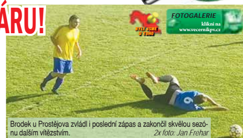
Brodek u Prostějova zvídá i poslední zápas a zakončil skvělou sezónu dalším vítězstvím.

Selucky i Kratochvíl ale nedokázali najít prostor branky. V posledních minutě byli diváci svědky ještě šanci na obou stranách. Richter pláchl obraně, ale nenašel místo na zadní tyči zhruba o metr a na opačné straně páhl nad Nehera i Dvořák. Druhá půle začala v podobném duchu jako celý první poločas. Hned po třech minutách bylo skóre ještě navýšeno. Dlouhý pas za obranu našel Švéda, který vyhrál sprinterský soubor a zakončil přesně – 3:0. Dobromilice pak spálily dvě vyzložené šance. Fialka ani Kratochvíl svou hlavičku zcela osamoceni do branky neprotlačili. Brodek se neustále potýkal se hrou v ofsajdu, kterých bylo opravdu mnoho, kvůli jednomu z nich mu nebyla čtvrtá branka uznána. Čtvrté branky se ale