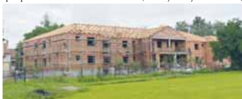
Práce na novém domově se zvláštním režimem jsou v plném proudu.

E. N.: „Pro naši malou obec je tento proces náročný, protože Domov má daleko větší rozpočet než obec sama. Zafinancovat tak rozsáhlou výstavbu není vůbec jednoduché a bez pomoci by to nebylo možné. Zároveň velký dík patří Olomouckému kraji, který nám přispěl téměř sedmácti miliony korun, a Ministerstvu práce a sociálních věcí, které se podílelo rovněž výraznou měrou. Zároveň musíme poděkovat všem, kteří se na realizaci projektu spolupodíleli.“