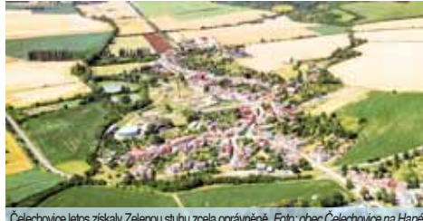
Čelechovice letos získaly Zelenou stuhu zosa oprávněně.

Za získáním ocenění stála řada významných projektů, které se v obci podařilo v posledním období uskutečnit. „V posledních letech se nám podařilo provést výsadby jak v obci, tak i v extravilánu. Velkým projektem, který jsme poslední dva roky realizovali, byl ÚSES (Územní systém ekologické stability – pozn.red.). Předmětem projektu je realizace části nových prvků, které byly vymezeny v rámci dokončených komplexních pozemkových úprav. Vznikly nové interakční prvky, lokální biocentra, biokoridory, regionální biokoridory a ovocný sad, které budou působit jako stabilizační část krajiny s pozitivním vlivem na okolí, včetně realizace I. etapy naučné stezky. Navázali jsme tímto projektem na stavby suchých poldrů ve Studenci i pod Kapli, které realizoval Státní pozemkový úřad. Cením si velmi dobré spolupráce. Podařilo se nám také ozelenit i další plochu v obci, což je část území po bývalém areálu cukrovaru získaného darem od firmy Armax Oil Děčín. Vytvořili jsme zde projekt Obecní park u cukrovaru. Myslím si, že to byly hlavní aspekty k získání ocenění, ze kterého mám upřímně velkou radost,“ uvedla dopodrobna starostka Čelechovic na Hané.