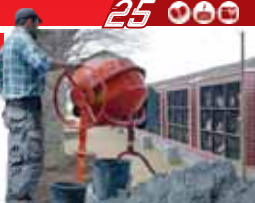
kapacita hřbitovů v prostějově

Prostějov (mla) - Čtrnáctiletá dívka se zranila na pučené koloběžce. Havarovala na pučené koloběžce. Čtrnáctiletá dívka se zranila na pučené koloběžce. Havarovala na pučené koloběžce.