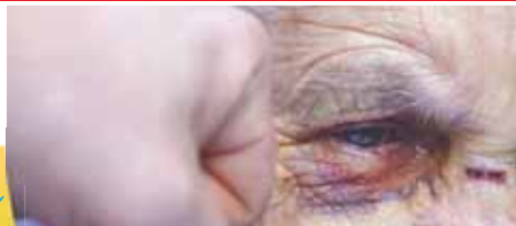
Senior bojuje nyní o svůj život pod dohledem lékařů, násilník sedí ve vazební věznici a hrozí mu deset let kriminálu.

ČELECHOVICE NA HANĚ Neuvěřitelně brutální napadení čtyřašedesátiletého muže spojené s krádeží peněz v domě s pečovatelskou službou v Čelechovicích na Haně nyní vyšetřuje prostějovská kriminálka. Senior nyní po způsobených těžkých zraněních bojuje o holý život v nemocnici, násilník skončil ve vazbě. Co se v pondělí odpoledne stalo? Večerník celou událost exkluzivně zjistil z výpovědi očitého svědka!