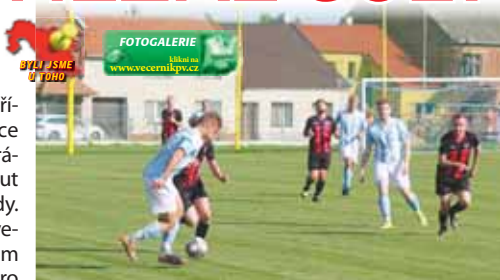
Po většinu utkání byli Určice více na balónu.

URČICE Poslední zápas sezóny v „B“-skupině I.A třídy Olomouckého KFS proti sobě postavil Určice a Protivanov. Oba regionální týmy už o moc nehrály. Protivanov se však mohl ještě v tabulce posunout o jedno místo. Ovšem jen v případě výhry za tři body. Nestalo se, a to i přesto, že hostující celek v Určicích vedl. Domácí ale dokázali penaltou krátce před koncem srovnat. A závěrečné pokutové kopy dopadly lépe pro družinu kouče Petra Gottwalda.