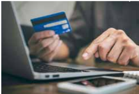
Muž z Prostějova předal prostřednictvím internetu cizím mužům své bankovní údaje, a pak se nestal divit.

muž přišel nekalé praktiky investiční společnosti osobu oznámit na policii. Celkově přišel poškozený o necelých 292 tisíc korun“, konstatovala Miluše Zajícová.