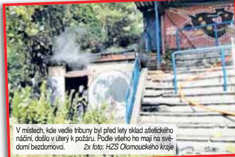
V místech, kde vedle tribuny byl před lety sklad atletického nádrní, došlo v úterý k požáru. Podle všeho ho mají na svědomí bezdomovci.

Došlo zde k zahoření většího množství odpadu a jiného materiálu. Viditelný hustý kouř ostatně potvrdil i velitel zásahu během jízdy k místu vzplanutí. Hasiči v zakoupených prostorách pracovali s možností přítomnosti tlakových, tedy nebezpečných nádob. Při požáru se nikdo nezranil, vlastník pak nenáročoval žádnou škodu,“ uvedl k případu Zdeněk Hošák, tiskový mluvčí Hasičského záchranného sboru Olomouckého kraje.