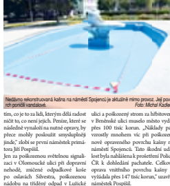
Nedlouze rekonstruovaná kašna na náměstí Spojenci je v dalšíh mrazu znovu již po třetí vandalizována.

PROSTĚJOV Vandalové v jejich... Letošní škody už za čtvrt milionu! Vandalové ničí majetek města.