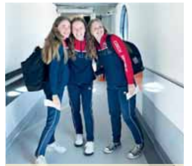
Tři mladé korbalistky SK RG Prostějov reprezentovaly ČR na Světovém poháru U17 v Nizozemsku.

Poslední soustředění před nadcházejícími Světovými hrami 2022 v USA absolvovala reprezentace dospělých ČR. Šlo o tři přátelské zápasy v Nemecku, kde se povedlo zdotlat tamní nároďák 19:16 (9:12), zatímco výběr Nizozemska U19 byl