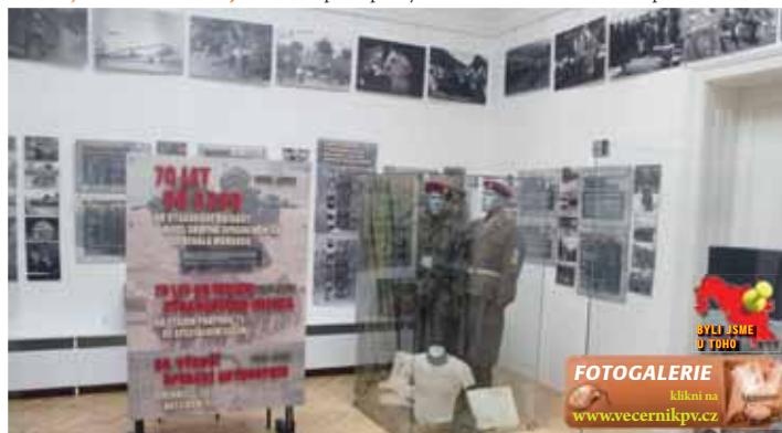
V muzeu pořádají výstavu věnovanou 601. skupině speciálních sil.