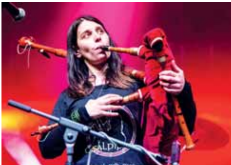
Poslední Keltská noc se konala v roce 2019.

Kdo má rád irskou a keltskou hudbu a irský tanec, může o prázdninách opět prožít krásný keltský víkend v Plumlově. Jednou z hlavních hvězd bude tentokrát rakousko-skotská skupina Celtica, jejíž osobitě rockové pojetí keltské hudby spojené s unikátní pídiou show slaví úspěchy po celém světě. Dále se představí Císal Pipers z Itálie, jejichž hudba vychází z pečlivého historického výzkumu. Ve své autorské hudbě experimentují i se žánry, které se zdají být od keltské či historické muziky na míle daleko. Společně s Kozák Bandem vystoupí Radim