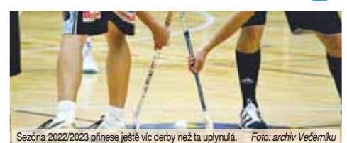
Sezóna 2022/2023 přinese ještě více derby než ta uplynulá.

Derby však vzniklo i již zmiňovaným sloučením soutěží, konkrétně Olomoucké soutěže a Olomouckého přeboru mužů. Nově se tak budou v malém derby utkávat i rezervy Playmakerů s Kostelem na Hané. Oba týmy se přitom dobře znají, v minulosti spolu kluby itřnávají. Aby toho nebylo málo, rovněž na juniorské úrovni se budou setkávat dva týmy z regionu, tentokrát oba zástupci Prostějova. Shodou okolností tak zatímco 5. listopadu vyvze „A“ tým Kostelec na Hané Playmakery, se stejný den, a navíc v Prostějově se utkají oba juniorské celky z Prostějova. Příští ročník pak bude ve znamení hned