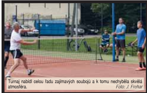
Turnaj nabídl celou řadu zajímavých souborů a k tomu nechyběla světlá atmosféra.