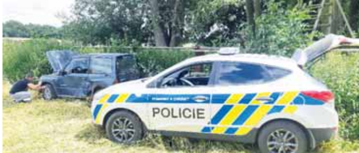
Honička policistů za zfetovaným řidičem terénního Suzuki skončila až výstřely do pneumatik nedaleko Pěncína.

Ne zcela běžnou službu zazili v úterý 12. července policisté z obvodního oddělení Konice. „Hlídka provádějící běžnou hlídkovou činnost zahlédla v protisměru jedoucí terénní vozidlo značky Suzuki směřující od obce Štarnov na Přemyslovce. Auto přitáhlo pozornost policistů tím, že mu chyběly registrační značky a mělo poškozené čelní sklo. Na první pohled bylo zřejmé, že vozidlo nesplňuje stanovené podmínky pro bezpečnou jízdu v silničním provozu,