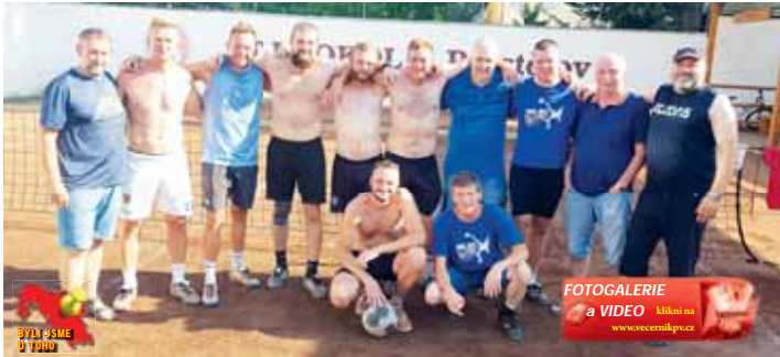
FOTOGALERIE a VIDEO klikněte www.vecernikpv.cz