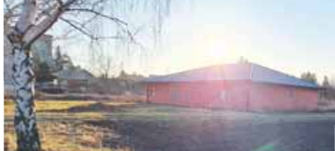
Nad dlouhým Stínem minulosti v Bedihošti konečně zasvitlo slunce.

BEDIHOŠŤ A neuvěřitelné se stalo skutkem! Tímto výkřikem by bylo možné oslavit kolaudaci Domova pro seniory v Bedihošti. Navzdory opakovaným slibům o dokončení stavby, s níž se začalo už v roce 2015, to vypadalo, že rozestavěný dům zůstane pouze STÍN MINULOSTI. Nyní se však projekt, u jehož kořenu stála bankrotářka Kateřina Koldová, podařilo dotáhnout do konce. O celkem deset míst v domě s dotovaným nájemným už projevilo zájem pět lidí.