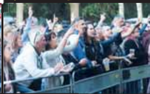
Pod pódiem nebylo k hnutí, letošní Rock Memory Of nalákal stovky lidí.