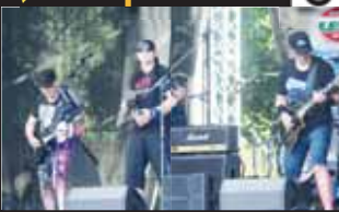
Metalová kapela ATD v sobotu zahajovala celý rockový večer na přehradě.

Fotoreportáž jak se na přehradě „rockovalo“