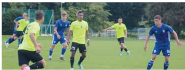
Je rozhodnuto? Fotbalové eskáčko spěje s budováním kádrů pro nový soutěžní ročník k závěru.

— ESKÁČKO ČEKÁJÍ PŘED SEZÓNOU — JEN KOSMETICKÉ ÚPRAVY