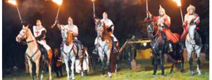
Josefkol se naposledy konal před třemi lety. Tehdy uchvátil mimo jiné i noční show.

Akce roku v Čechách pod Kosířem už o víkendu