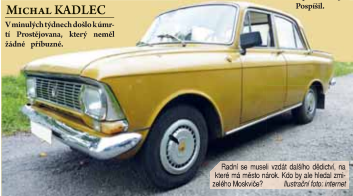
Radní se museli vzdát dalšího dědictví, na které má město nárok. Kdo by ale hledal zmlazeného Moskvíče?