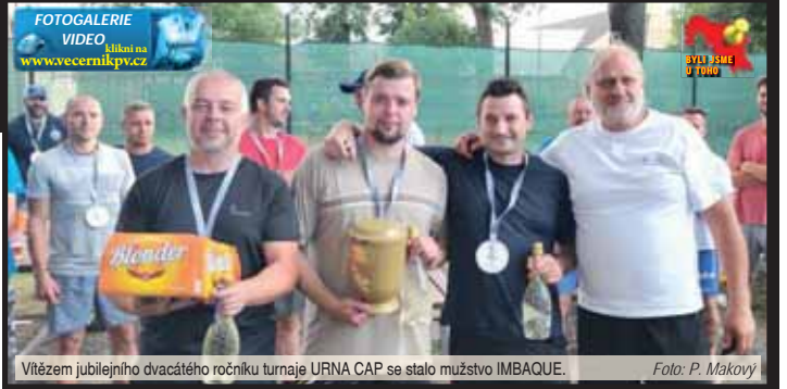
Vítězem jubilejního dvacátého ročníku turnaje URNA CAP se stalo mužstvo IMBAQUE.

Kromě nohejbalu se ale v Sokolském parku v Kralicích mohli hráči i fanoušci těšit na řadu dalších aktivit. Ti nejmenší se bavili na skákacím hradu a také si vyzkoušeli první nohejbalové kopy na