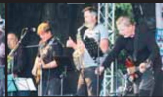
Skupinu Keks si dříve narození pamatují už ze zábav z 80. let minulého století.