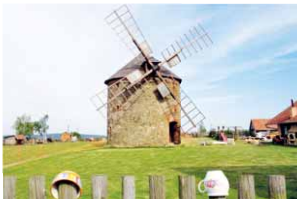
Mlýn v Přemyslovicích byl opraven pod dohledem památkářů.

Důvodem žádosti o vytvoření ochranného pásma zřejmě byla chystaná změna územního plánu, která by umožnila výstavbu rodinných domů v okolí mlýna. O tu usiluje obec. „Věc se ovšem má tak, že nové domy by vyrůstaly na druhé straně asfaltové cesty, než stojí samotný mlýn.