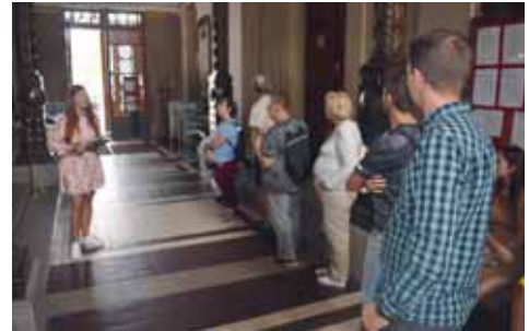
Dny evropského dědictví začaly v Prostějově už během Hanáckých slavností, kdy se zájemci zúčastnili komentovaných prohlídek prostějovské radnice.