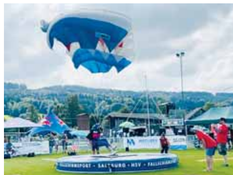
Prostějovským parašutistům vyšel Světový pohár v Rakousku výborným způsobem.