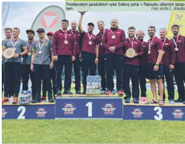
Za soutěží družstev se na bedně sešlo všech deset borců Dukly: A-tým zvítězil, béčko skončilo třetí.