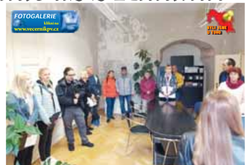
Neodmyslitelnou součástí akce Po stopách Pernštejnů byla prohlídka místnosti prostějovského zámku, ve kterých se dochovala původní renesanční výzdoba.