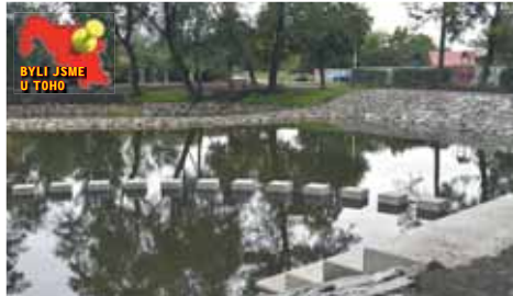
Revitalizovaný rybníček ve Vrahovicích si v pátek se zájmem prohlédli i představitelé prostějovského magistrátu.