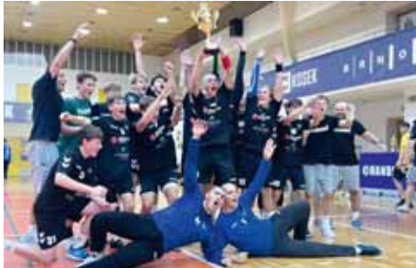
Mladší dorostenci HAOLK se radují z triumfu na přípravném turnaji v Brně.