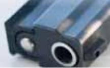
Otec dvou slavných prostějovských hokejistů se zastřelil. Podle všeho neunesl svoji nemoc.