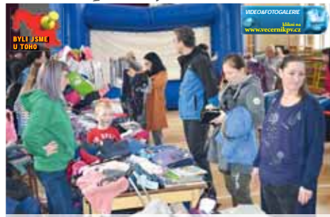
Dětský bazárek v prostějovské sokolovně tradičně přilákal spoustu rodičů, kteří tak za velmi příznivé ceny nakoupili svým dětem oblečení.

Na akci byl vstup jako vždy zdarma a již v devět hodin ráno dorazili do sokolovny první návštěvníci. „Maminky a tatínkové zde najdou opravdu pestrý sortiment nabízeného oblečení, které za velmi přijatelné ceny prodávají jiní rodiče. Kromě toho jsme se po letech covidu vrátili při akci i k zábavné části pro děti, máme tady skákačci hrad společně s malováním na obličej, prezentujeme programy