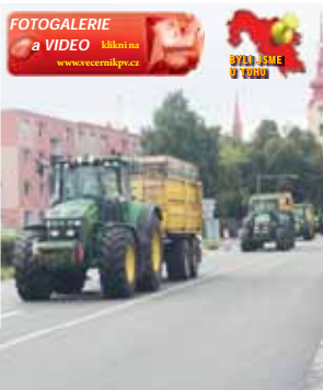
Zemědělci protestní jízdou vyjádřili své obavy z dopady snahy EU o „zelenější Evropu“.