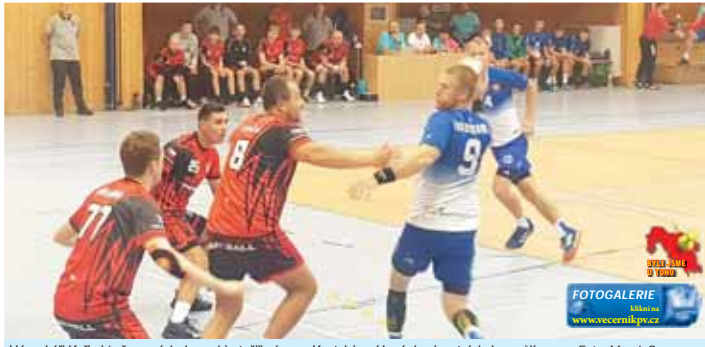
Házenkáři Kuřimi (v červených dresích) otočili zápas v Kostelci na Hané dominantní druhou půlí.