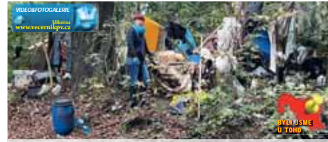
Náměstkyne prostějovského primátora před jedním z bezdomoveckých hnízd.

Alce pořádaná Okrašlovacím spolkem Prostějov má ve městě dlouhodobou tradici. Dobrovolníci se obvykle dvakrát ročně schází na dvou místech. Jednak v Olomoucké ulici u penzionu Stella a také u obcestvení U Abrahámka. Tentokrát panoval ruch pouze u prvního z nich. Spolupořádající organizace Ekocentrum Iris totiž měla na daný termín již dlouho dopředu zablokovanou geologickou exkurzi na sever Moravy.