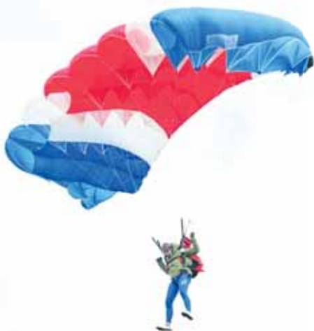
Jeden z prostějovských parašutistů v akci na MČR 2022 v Jindřichově Hradci.