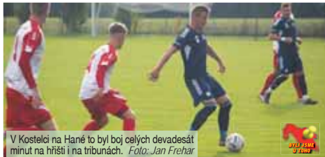
V Kostelci na Hané to byl boj celých devadesát minut na hřišti i na tribunách.

to jako faul neposoudil, a ještě odpískal aut pro domácí, který v zádném případě nebyl. Do poločasu přišla ještě jedna zajímavá šance, kdy výkop opět našel Preislera, ale ten našel prostor na přední tyči z opačné strany, než by si přál.