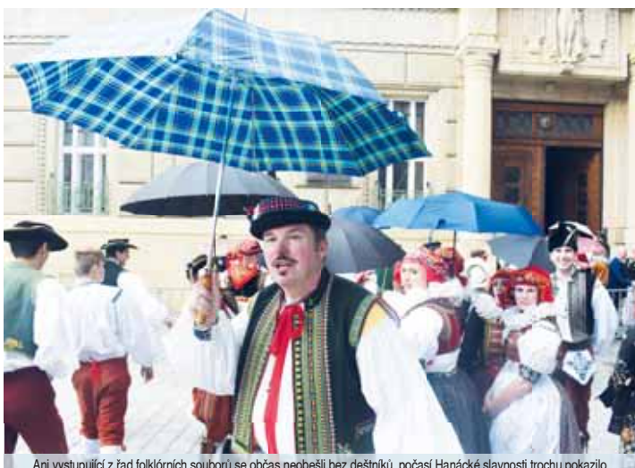
Ani vystupující z řad folklórních souborů se občas neobešli bez deštníků, počasí Hanácké slavnosti trochu pokazilo.