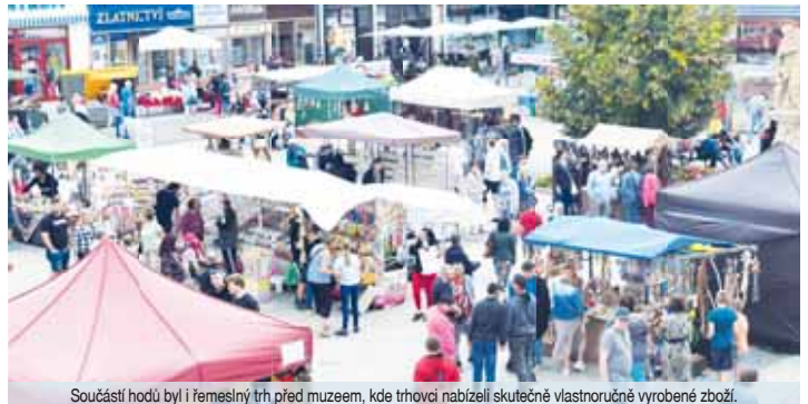
Součástí hodů byl i řemeslný trh před muzeem, kde trhovci nabízeli skutečně vlastnoručně vyrobené zboží.