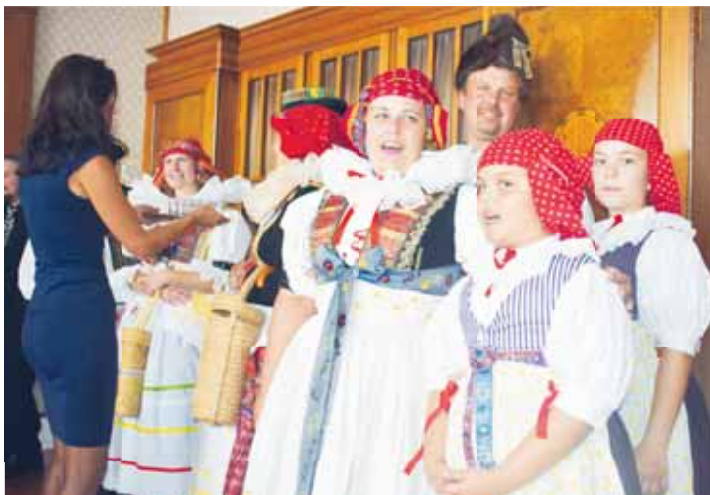
Krásná podívaná, když se radnici rozléhaly lidové písničky v podání i nejmladší generace z folklórních souborů.