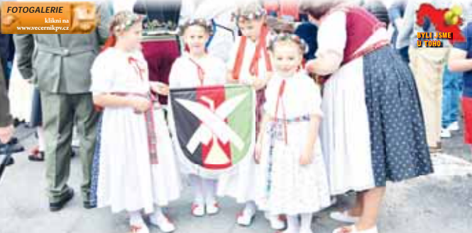
Celodenní program sjezdu rodáků v Pivíně nezhatilo ani nepříjemné počasí a všichni si ho užili.

PIVÍN V malebné obci se při letošním sjezdu rodáků Pivína slavila hned dvě jubilea. V loňském roce to bylo přesně 700 let od prvního písemného záznamu o obci a letos je to sto let od založení místního Sokola. Na nedávné akci se představilo více než 300 osob, nechyběli tak pozvání rodáci a občané obce. Do celodenní akce se společně s obcí zapojily i všechny místní spolky, které si připravily skvělý program i bohaté občerstvení. Nikdo tak nepříšel zkrátka. Jediným malým negativem akce bylo sobotní nevlídné počasí, které však organizátoři nemohli ovlivnit.