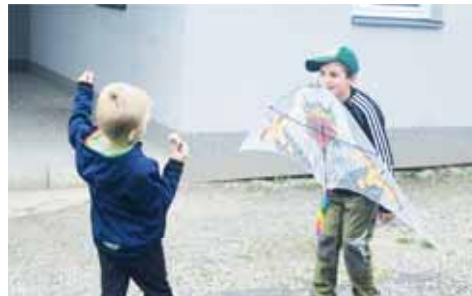
Drakiáda, to je každoroční lákadlo pro děti.

„Máme ji snad šestnáct let,“ konstatuje Eva Králíková, jedna z organizátorek. V tu chvíli vítr prakticky neexistuje. Kdo chce pouštět draka, musí si pořádně popoběhnout. „Tady vítr nebyl. Ale vedle na poli, kam se nám lidé přesunuli, tam fúcelo. A létalo to krásně. Záměr je, a to je dobře,“ míní Králíková. Mezitím se u občerstvení, kde se stará o žaluzky přítomných, formují skupinky kolem ohniště. Pro ty, které už pouštění draků unavilo, mají organizátoři nachystané uzenky – pro děti zdarma, pro dospělé za pár ko-