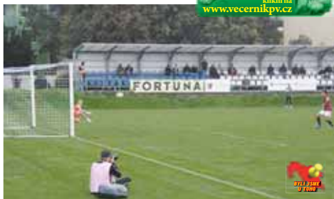
Kapitán hostů Pudhorocký právě proměřuje penaltu, o výsledku je rozhodnuto.