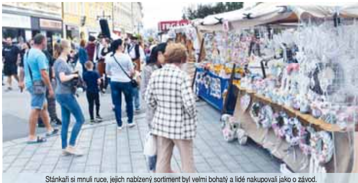
Stánkaři si mnují ruce, jejich nabízený sortiment byl velmi bohatý a lidé nakupovali jako o závod.