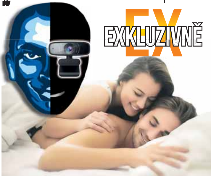
Neznámý útočník vyhrožoval, že zveřejní záznamy manželských intimností pořízené prostřednictvím webové kamery. Ilustrační koláž Večerníku