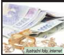
Ilustrační foto: internet