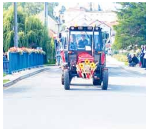
Na spanilé jízdě se opět představila spousta vozidel, která si mohli lidé prohlédnout.

dvou hostinstvích. Přišlo nedělní ráno a řada příznivců vítala tradiční spanilou jízdou historických vozidel. O sportovní zážitky se letos starali jen fotbalisté, kdy se odehrálo hned pět utkání během víkendů. Během hodových slavností si tak každý našel to své. Všichni účastníci mohli být spokojeni, protože i počasí poměrně vyslo, děšť se přihlásil až v neděli večer. (jaf)