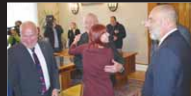
Podle uvolněné atmosféry po podpisu koaliční smlouvy se dalo soudit, že si noví partneři trojkoalice budou rozumět.