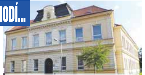
K nečekané návštěvě mělo dojít u volební komise fungující v budově zdejší ZUŠ.

Podobné anonymní oznámení doputovalo také na Policii ČR, která celou záležitost prověřila již během volební soboty 24. září. „Byli jsme upozorněni, že mohlo dojít k ovlivnění voleb do obecního zastupitelstva v Němčicích nad Hanou s tím, že kvolbám přišlo přes dvacet voličů, kteří k nim běžně nechodí. Na základě tohoto oznámení bylo provedeno šetření v dané věci. Během něj neby-