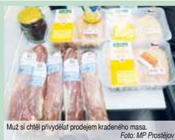
Muž si chtěl přivydělat prodejem kradeného masa.

„Na vysvětlenou svého počínání hlídce řekl, že zcizené maso chtěl dále prodat a tím si přivydělat,“ prozradila Tereza Greplová, Vedoucí skupiny prevence kriminality Městské policie s tím, že svým jednáním se muž dopustil přestupku proti majetku a jeho protiprávní jednání projedná příslušný správní orgán. (ofr)