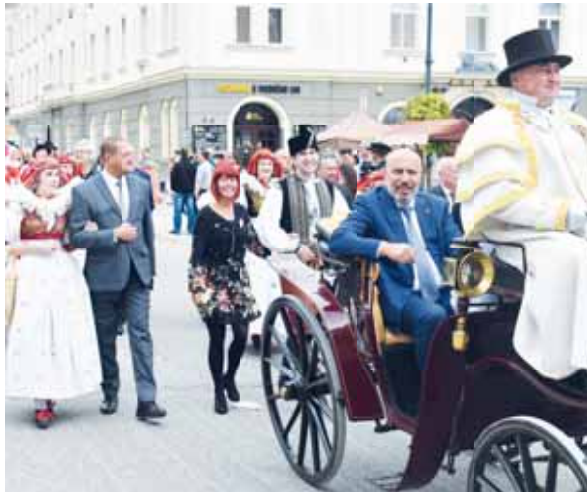
Primátor v kočáře, ostatní představitelé města v rámci slavnostního průvodu městem museli šlapat za ním pěšky.