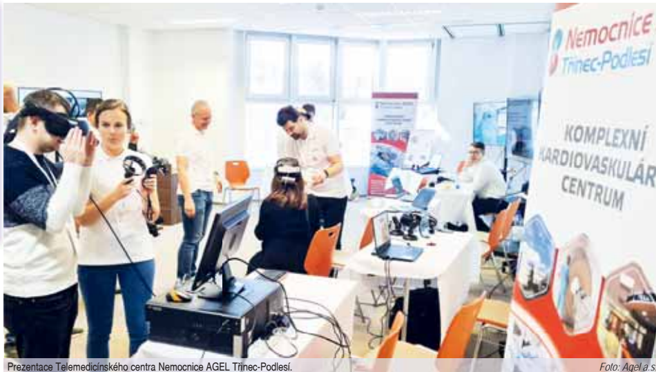
Prezentace Telemedičnického centra Nemocnice AGEL Třinec-Podlesí.

Ve středu 5. října přednáškový blok zahájí profesor RNDr. Ladislav Dušek, Ph.D. ředitel Ústavu zdravotnických informací a statistiky ČR s odbornou prezentací Doba covidová, hlavní sál kongresového hotelu NH Collection Olomouc poté bude patřit panelové diskusi na téma Digitalizace – realita českého a slovenského zdravotnictví. „Digitalizace je v dnešní době jedním ze základních