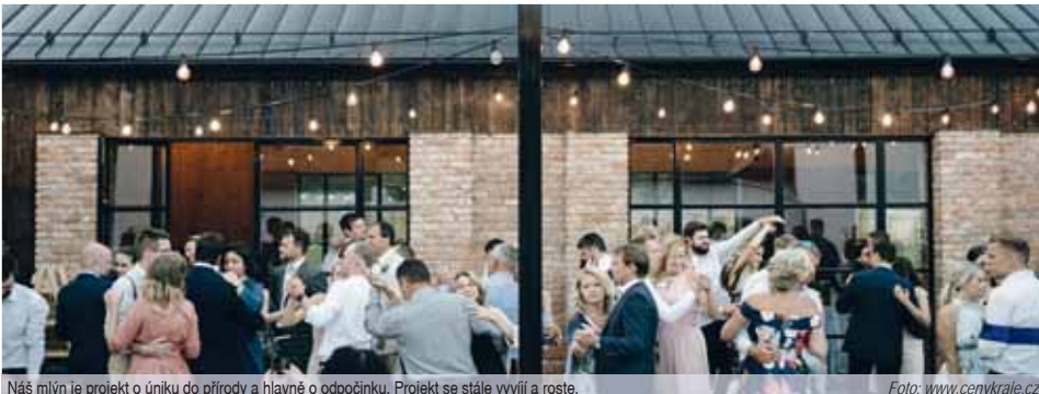
Náš mlýn je projekt o úniku do přírody a hlavně o odpočinku. Projekt se stále vyvíjí a roste.

Dalšími regionálními železky v ohni byly tentokrát v kategorii „Rozhledny“ Kopaninka v Repechách a rozhledna na Kosíři. Ani jedna z nich na vítězství nedošla, z něj se nakonec těšila Nadhledna Háječek stojící u obce Svěbohov nedaleko Zábřehu. (mls)