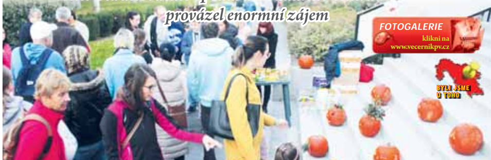
Po splnění pěti úkolů čekala na všechny děti na konci stezky u kina Metro 70 sladká odměna.