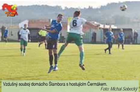
Vzdušný soubor domácího Šlambora s hostujícími Čermákem.