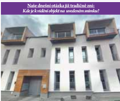
Naše dnešní otázka již tradičně zní: Kde je k vidění objekt na uvedeném snímku?