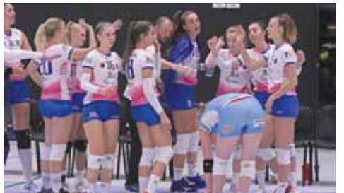
Prostějovské volejbalistky U22 jsou v extralize této věkové kategorie průběžně osmé.

Pokud by jeho svěřenkyně na závěr dne porazily i Hradec Králové, posunuly by se pro druhé extraligové dějství do běčka. Leč podlehlý 1:3. „Vývoj byl dost podobný, ale v opačném gardu. Tentokrát nás těsně prohraná druhá sada výsledkem 30:32 srazila dolů, následně už měl navrch Hradec a my jsme trochu odpadli“, uznal Sklenář.