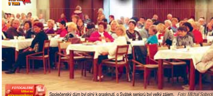
FOTOGALERIE Klikni na www.vecernikpv.cz

Společenský dům byl plný k prasknutí. O Svátek seniorů byl velký zájem.