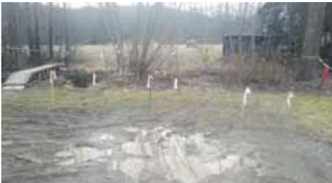
Takto po deštích končí soukromé pozemky některých chatařů, na nichž se otáčejí auta návštěv jejich sousedů.

„Absolutně není pravda, že nyní ohrazené pozemky řadu let sloužily všem! To je vyfantazírovaná představa vašeho pořídního zdroje. Vždy se jednalo o výlučné soukromé pozemky, které pouze na základě svobodného rozhodnutí majitelů nebyly ohrančené, ale desítky let „pouze“ označené dopravní