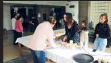
Na akci nemohla chybět ani „občerstvovací zastávka“.