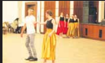
Představila se i taneční škola Pirouette.