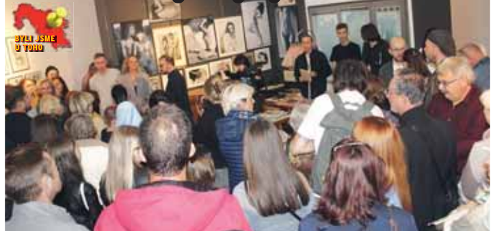
Na vernisáži výstavy byla doslova hlava na hlavě.