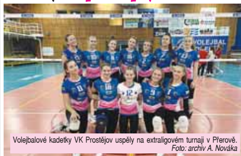
Volejbalové kadetky VK Prostějov uspěly na extraligovém turnaji v Přerově.