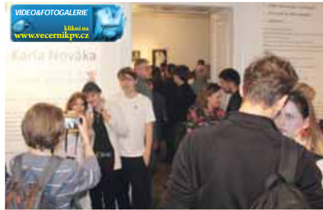
Mnozí ze zájemců se do sálu vůbec nedostali.