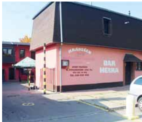
V pátek hodinu po poledni už v restauraci i jejím okolí panoval opět naprostý klid.