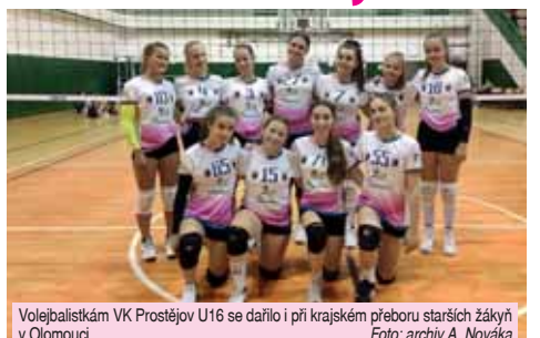
Volejbalistkám VK Prostějov U16 se dařilo i při krajském přeboru starších žákyní v Olomouci.