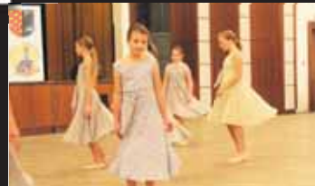
Velká část vystoupení byla tanečního rázu.