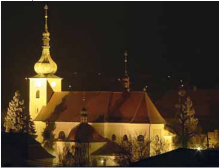
Pohled na osvětlený kostel je v Konici již minulostí.

Konice přitom hledá možnosti dalších úspor. Ve hře je i přizpůsobení pracovní doby úředníků na radnici či zaměstnanců příspěvkových organizací tak, aby všichni maximálně využívali přirozené denní světlo.