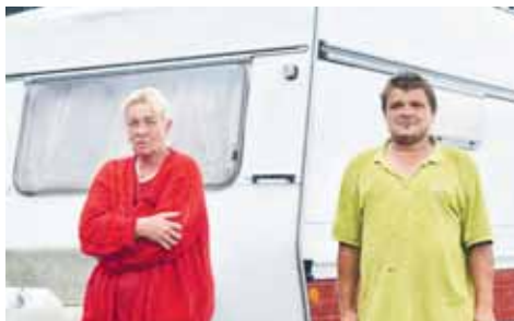
Bezdomovecký pár přezívá v karavanu za železničním přejezdem ve Vrahovické ulici.

PROSTĚJOV Chlapík, který se nezmění! Redakci Večerníku opakovaně kontaktoval bezdomovecký pár, který přezívá v karavanu za železničním přejezdem ve Vrahovické ulici kousek od benzinky. Přestože se muž letos v létě dušoval, že nikoho neobtěžuje, svým chováním dokazuje spíše opak. Svého vulgárního partnera nedokáže zkrátit ani žena, která si Večerníku postěžovala, že jejich karavan někdo opakovaně poškodil. Podle svědků muž přezívající se svojí družkou v karavanu na parkovišti za nádražím často kolemjdoucí bezostyšně otravuje, zěbrá a často se uchyluje také k nadávkám či vyhružkám. Není divu, že už si někteří občané stěžují přímo na magistrátu a požadují ochranu před tímto člověkem. Svě o něm ví i zástupci prostějovských strážníků. Ostatně v minulosti už měl podobně obtěžovat u domu s pečovatelskou službou v Brněnské ulici. Právě tento muž si přišel do redakce Večerníku postěžovat i se svojí družkou. „U nádraží bydlíme asi patnáct měsíců. Přes léto nám někdo dvakrát rozbil karavan. Také mi někdo zabil pět koček, a ještě nás tu