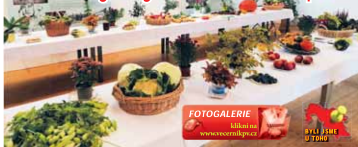
V letošním roce se po dlouhých letech vrátila i výstava ovoce a zeleniny.