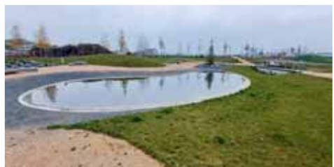
Retenční nádrž Mládkovy sady má po inovaci i celkový pohled je krásný.

PROSTĚJOV Mládkovy sady jsou poměrně novým parkem jižně od ulice Okružní v Prostějově. Vybudován byl na ploše využívané jako orná půda, konkrétně v místě, kde byla plánována a již probíhá výstavba bytových domů. V souvislosti s budováním parku byly provedeny terénní úpravy včetně terénních modelací, byly vysazeny listnaté stromy, keře, založen trávník a květnatá louka. Současně byla vybudována cestní síť, retenční nádrž a park byl doplněn mobiliárem jako jsou lavičky, odpadkové koše či sedací přírodní prvky. V neposlední řadě