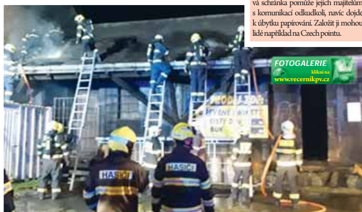
Nebýt rychlého zásahu hasičů, mohla být škoda u prostějovského místního nádraží daleko vyšší.

děkování Ludvík Bittner. „Problém s bezdomovci panují dlouhodobě a nic se s tím neděje. Snad se to nyní začne více řešit,“ zadoufal.