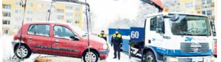
Vrak v ulicích Prostějova? Nepěkný, ale stále častý úkaz.