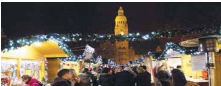
Vánoční trhy se každoročně stávají živým ostrůvkem uprostřed večerního města.

Jestli před deseti a více lety byly tu a tam k vidění také oplachtované kovové konstrukce, které spíše prostor hyzdily, než aby mu dodaly vánoční atmosféru.