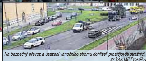
Na bezpečný převoz a usazení vánočního stromu dohlíželi prostějovští strážníci.