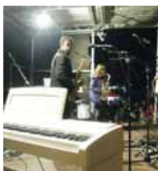
Koledy v podání saxofonu byly zážitkem.

Počtené zástupy místních se začaly postupně scházet už po čtvrté hodině od-