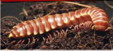
Tyto okrajenu žlutoskvřné byly v ČR zatím objeveny jenom tři. Jedna z nich v zoo na Svatém Kopečku. Klidně ji ale můžete mít i vy doma v květináči.

Pokud někdo na okrajenu narazí, není nejmenší důvod se jí bát, či ji likvidovat. Podle kurátora sbírky bezobratlých Národního muzea Petra Dolejša není ani v nejmenším nebezpečná a už vůbec