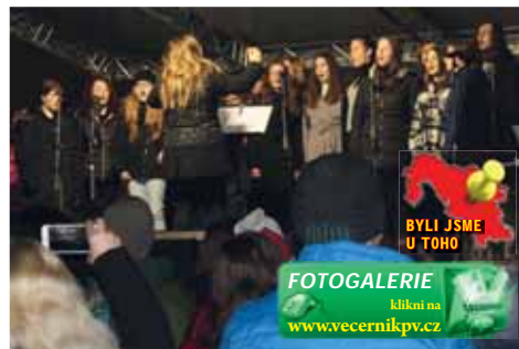
Zřejmě ani členové dětského pěveckého sboru Kolotoč z prostějovské ZUŠky nepočítali s tím, že budou někdy vystupovat před takto početným publikem.