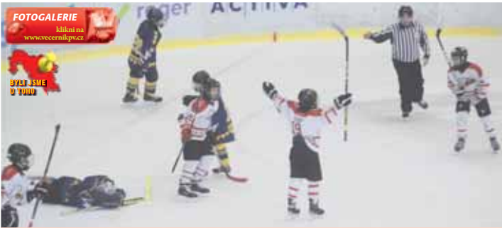
Prostějovští hokejoví „páťáci“ si v derby se Šumperkem zastříleli.