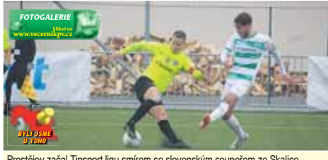
Prostějov začal Tipsport ligu smírem se slovenským soupeřem ze Skalice.