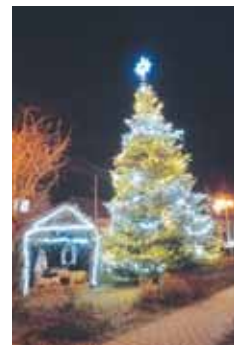
V Otaslavicích už stromeček také zdobí centrum obce.

Už od čtrnácti hodin začal v prostorách sokolovny předvánoční jarmark. Od 16.30 pak začal program v centru obce, kde si své vystoupení připravily děti z mateřské školy i žáků místní základní školy a k poslechu vše doprovodila skupina Markovanka. Krátce po sedmnácté hodině pak přišlo rozsvícení stromečku, kde nechyběl i tradiční betlém, který je v obci stálým členem vánočního období. O občerstvení v podání punče, ale i uzeniny a domácího vánočního cukroví se postarala obec společně s místními hasiči. (jaf)