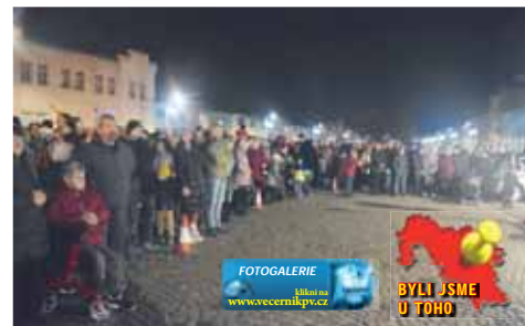
Rozsvícení stromku v Němčicích přivítalo na náměstí davy.