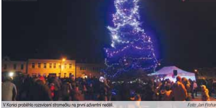
V Konici proběhlo rozsvícení stromečku na první adventní neděli.