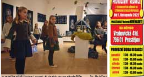
Na vernisáži ve stylizovaných kostýmech vystupují děti z tanečního sboru prostějovské ZUŠ.