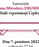
Dne 7. prosince 2022 uplynulo 27 let, co nás navždy opustil pan Bohumil BEZOUŠEK , a dne 2. ledna 2023 vzpomněme nedožitě 92. narozeniny paní Ludmily BEZOUŠKOVÉ . Děkujeme všem, kteří jim věnují krátkou vzpomínku. Dcera a syn s rodinou.