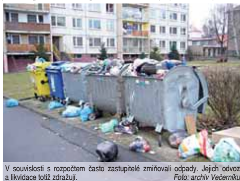
V souvislosti s rozpočtem často zastupitelé zmiňovali odpady. Jejich odvoz a likvidace totiž zdražují.

rozpočtu se nakonec vyslovili pouze dva přítomní zastupitelé. „Byly určeny investice, dále peníze a plán a provoz a údržbu. Celkem počítáme s příjmy ve výši 1,2 miliardy korun a výdaji 1,3 miliardy,“ shrnul