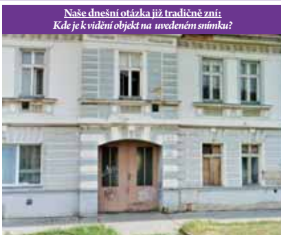
Naše dnešní otázka již tradičně zní: Kde je k vidění objekt na uvedeném snímku?