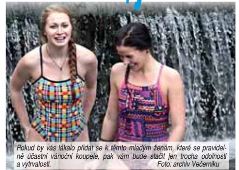
Pokud by vás lákalo přidat se k těmto mladým ženám, které se pravidelně účastní vánoční koupele, pak vám bude stačit jen trocha odolnosti a vytrvalosti.

U otužování je důležitá postupnost, dlouhodobost a soustavnost. První příznivé účinky otužování by se na vás měly projevit do čtyř týdnů. Neměli byste ale s otužováním přestávat, protože tělo si rychle odvykne a celý proces pak začíná znovu. Výraz „postupnost“ v tomto případě znamená začínat od kratšího a méně intenzivního otužování a postupně přivýkat delšímu a silnějšímu ochlazení. Otužování přitom neznamená jen sprchování studenou vodou. Otužovat se lze i vzduchem. S ním je nejlepší začít v létě. V podstatě jde o to, vystavovat se klesajícím teplotám venku třeba při sportu nebo práci a nosit přitom příliš teplé oblečení.