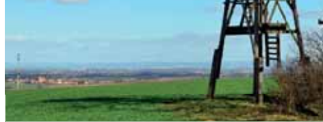
Rozhlednu nejspíš čeká postupná zkáza.

Rozhledna chátrá dál, k plošině se nedostanete