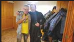
Na některé účastnické akce jako by dopadala sportovní svatozář za jejich zásluhu.