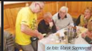
Samozřejmě došlo také na přípitek šampaňským, ten nemohl při vzácné příležitosti chybět.