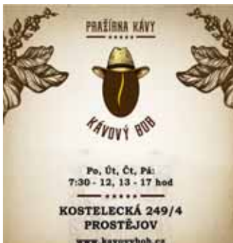
Výherce získá DÁRKOVÝ BALÍČEK čerstvě pražené kávy v hodnotě 400 Kč