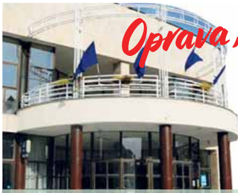
Zchátralý Společenský dům už rekonstrukci skutečně potřebuje.