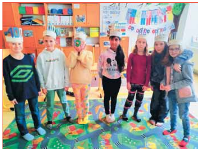
Žáci z Brodsku u Konice slaví stoleté výročí s plným nasazením, dobře vědí, že stopy „jejich“ školy navždy zůstanou otisknuty v jejich myslích.

svého druhu internát pro děti, které předtím musely do brodecké školy každý všední den docházet pěšky ze vzdálených horských osad a samot, a to i dvě hodiny po tmě po zavátých lesních cestách v mrazu a vánici. „Kraji brodeckému dostalo se tímto ústavu, jaký dosud pro žactvo venkovských škol národních nebyl u nás nikde zřízen, ústavu velkého sociálního a výchovného významu,“ informoval tehdy dobový tisk. Dnem otevřených dveří oslavy staleté brodecké školy nekončí. Už 20. června připomene stejnou událost pečlivě připravovaná školní akademie a vše vyvrcholí 1. září Slavnostním shromážděním ke 100. výročí školy. (mls)