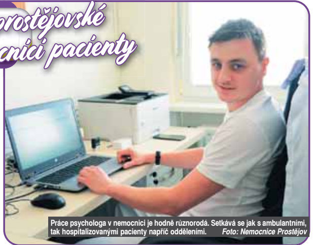
Práce psychologa v nemocnici je hodně různorodá. Setkává se jak s ambulantními, tak s hospitalizovanými pacienty napříč odděleními.

Psychologická péče je pacientům k dispozici také ambulantně. Zájemci mohou navštívit ambulanci psychologie na poliklinice Nemocnice Prostějov. Ambulance se věnuje také dospívajícím, u nichž odborníci v posledních letech zaznamenávají nárůst psychických obtíží, zejména úzkostí a depresí.