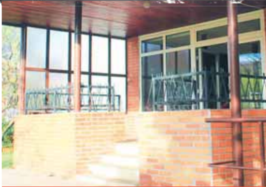
Jeden z nájemníků městského domu v ulici Marie Pujmanové se loni na jaře dostal do konfliktu se zákonem, problémy s ním dle některých obyvatel domu stále přetrvávají.

Večerník se v celé záležitosti obrátil i na konkrétní obyvatele domu. Ti nám potvrdili, že tak úplný klid v bytě zmiňovaného nájemníka už nějaký čas opravdu nepanuje. „Ti feťáci tam v poslední době zase chodí, točí se to tam, pořád tam někdo klepe na balkon, že chce dovnitř. Tak jsem na chodbě potkala úplně zřetovanou a konfliktní ženskou, která tady určitě nebydlí,“ popsala jedna z dlouholetých obyvatelk domu.