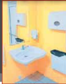
Jarním úklidem prošly také záchodky ve Školní ulici. 2* foto: Michal Kadlec a Magistrát města Prostějova

PROSTĚJOV Odbor správy a údržby majetku města úspěšně završil poslední fázi rozsáhlých rekonstrukcí veřejných WC v Prostějově. Modernizací prošlo celkem pět frekventovaných lokalit, které nyní nabízejí občanům i návštěvníkům města čistší a příjemnější zážitek. Rekonstrukce byla započata již na konci minulého roku. Celková investice v letošním roce byla ve výši 167 990 korun.