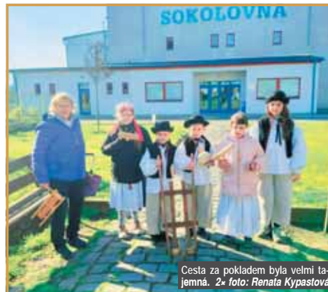
Cesta za pokladem byla velmi tajemná. 2* foto: Renata Kypastová

nenavštívili, protože jsme to prostě nestihli, mrzelo nás to. Proto se jim ze srdce omlouváme, příště se budeme více snažit. A věřte, že i tům, se