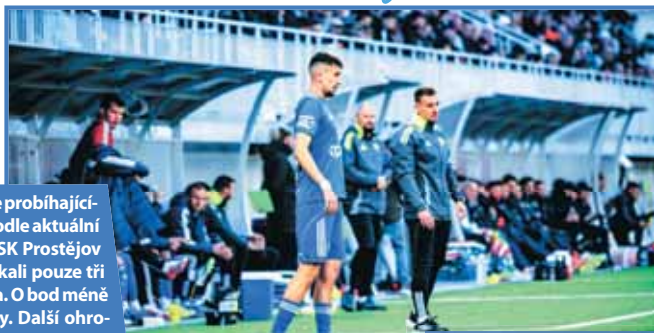
Začít sbírat body potřebuje Prostějov už tento týden.

PROSTĚJOV Osm kol chybí do konce probíhajícího ročníku Chance Národní ligy a podle aktuální formy to nevypadá s fotbalisty 1. SK Prostějov příliš dobře. V jarních zápasech získali pouze tři body, stejně jako jihlavská Vysočina. O bod méně vybojovala rezerva pražské Sparty. Další ohrožené týmy jsou na tom mnohem lépe, i proto se Hanáci propadli na sestupové patnácté místo.