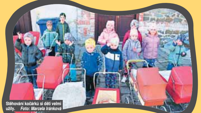
Stěhování kočárků si děti velmi užily.

VÍCEMĚŘICE V Muzeu života ve Víceměřicích se odehrála milá a výjimečná událost, která potěšila malé i velké návštěvníky. Do muzea se totiž dostala sbírka starých dětských kočárků pro panenky, mezi nimiž nechyběl ani sportovní typ.