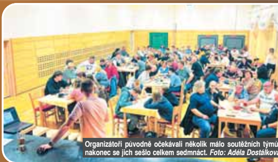
Organizátoři původně očekávali několik málo soutěžních týmů, nakonec se jich sešlo celkem sedmnáct.

Kvízy obecně nabírají na popularitě a ten tištin- ský přilákal přibližně stovku účastníků napříč generacemi. Pět soutěžních okruhů nabídlo otázky z filmů pro pamětníky, kulturních klasik i současné kinematografie. Během přestávek probíhalo sbírání odpovědních archů, jejich