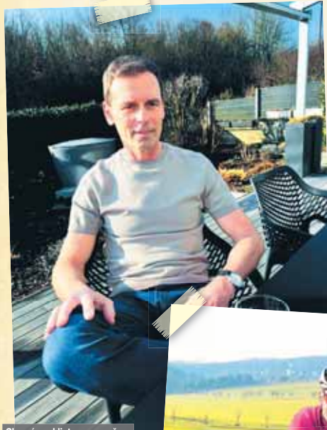
Slavný cyklista v současnosti doma u kafička...