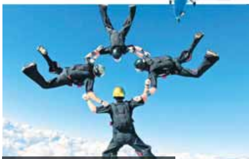
Parašutisté ASO Dukla Prostějov na soustředění v Americe, stát Florida.

„Závodní program bude od začátku června až do konce září hodně nabitý, proto se teď snažíme na náročnou sezónu co nejlépe tréninkově nachystat. Kluci v přípravě pracují podle plánu tak, abychom jak ve Světovém poháru, tak na obou mistrovstvích světa znovu patřili do nejužší mezinárodní špičky. Samozřejmě včetně zisku ko největšího počtu medailí,“ nastílní hlavní trenér ASO Dukly PV Libor Jiroušek. (son)