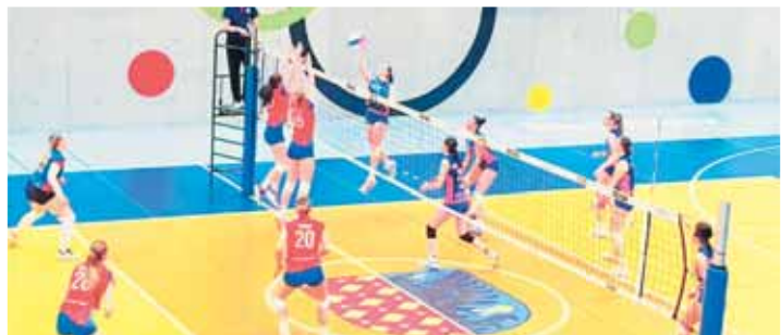
Momentika z domácího utkání volejbalových kadetek VK Prostějov s Olympem Praha.

Nadstavbová skupina I o 1. až 6. místo – průběžné pořadí: 1. Liberec 28, 2. Olymp Praha 26, 3. Orion Praha 26, 4. KP Brno 23, 5. VK Prostějov 15, 6. Ostrava 9.