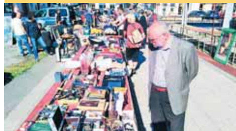
Neděle na prostějovské tržnici budou jednou měsíčně opět patřit bleším trhům.

PROSTĚJOV Sběratelské a bleší trhy se vrací do Prostějova. Oblíbené akce se opět budou pravidelně konat na prostějovské tržnici. Vůbec první z nich je naplánována na neděli 19. dubna od 8 do 11 hodin.