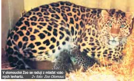
V olomoucké Zoo se radují z mláděť vzácných levhartů.

OLOMOUC Ve volné přírodě levhartů mandžských žije posledních zhruba 130 jedinců. Olomoucká zoologická zahrada prožívá nevšední radost, neboť se po desetileté pauze v pavilonu, v němž se chovu těchto vzácných kočkovitých šelem věnují, nachází o tři kotěcí očásky navíc! Jejich otec přicestoval do olomoucké zoo ze Zoo Nordhorn v Německu s jediným posláním – zanechat po sobě potomky se samičkami pocházejícími ze Zoo Granby v Kanadě. A to se nyní i naplnilo!