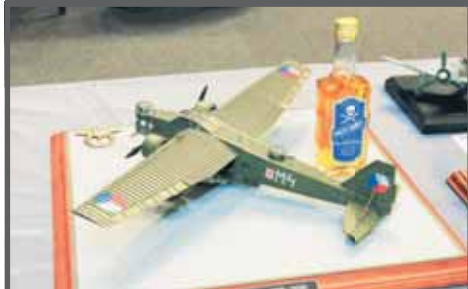
Letoun Aero MB.200 ocenili i modeláři ze slovenského klubu Zboror Nitra.

Letadla, lodě, technika, motorky i dioráma nadchly diváky