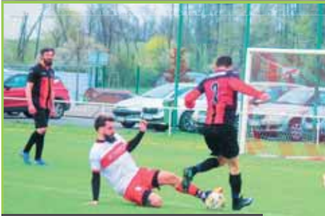
Protivanov potvrdil roli favorita.

Favorizovaný Protivanov si proti Smržicím oddechl až v závěru