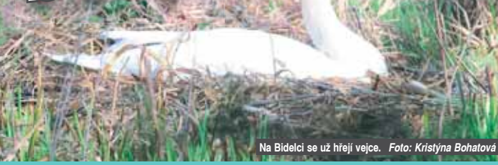
Na Bidelci se už hřejí vejce.

PROSTĚJOVSKO Stejně jako se těšíme na potomky čápů, dělají nám radost i rodiny labutí. A že jich letos na Prostějovsku bude! My víme hned o několika hnízdech. Třeba na rybnících v Hrdibořicích, Čelčicích, Drahanech a Plumlově na Bidelci i Podhradáku. Jen na vodní ploše u Čunína se zatím párek labutí o stavbu hnízda nijak nesnaží. Tak uvidíme, kolik šedivých ochmýřených kulíček nakonec napočítáme. (kib)