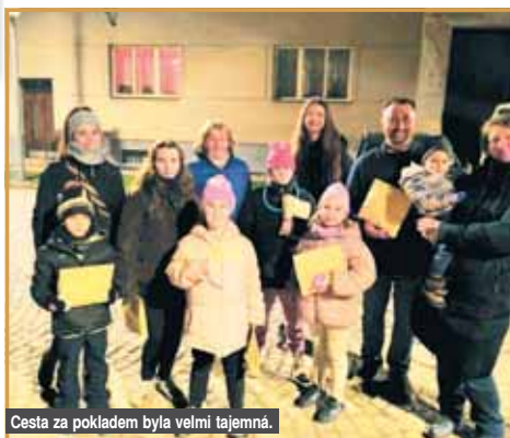
Cesta za pokladem byla velmi tajemná.