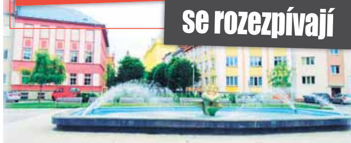
Kašna na náměstí Spojenců projde před uvedením do provozu zhruba měsíc trvající rekonstrukcí.

PROSTĚJOV V průběhu dubna dojde v Prostějově k postupnému zprovoznění všech šesti městských kašen, které každoročně patří k oblíbeným prvkům veřejného prostoru i symbolům příchodu jara. Jako první byly již 1. dubna spuštěny kašny na náměstí T. G. Masaryka, Vojáckově a Hlaváčkově náměstí a také kašna v parku v ulici Josefa Lady.