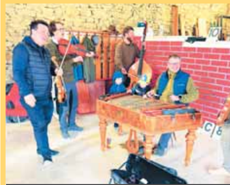
Struna to parádně rozjela.