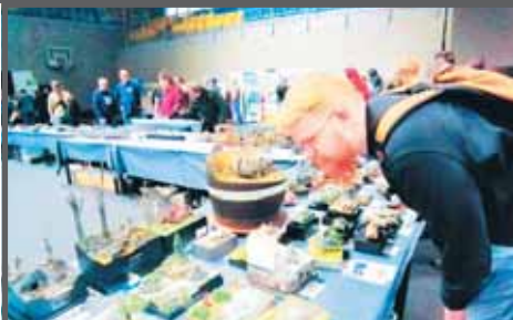
Modely přilákaly řadu nadšenců nejen z Čech a Moravy.

PROSTĚJOV Veřejnou soutěž a výstavu plastických modelářů „VELIKONOČNÍ PROSTĚJOV“ 2026 uspořádal v pátek 3. dubna v prostějovském Sportcentru – DDM Hanácký klub plastických modelářů při AMK MINERVA Prostějov ve spolupráci s MK Výchov a KPM Tovačov. Mezinárodní dostaveníčko modelářů všech věkových kategorií přilákalo stovky návštěvníků nejen z Čech. Měli možnost zhlédnout zhruba 750 modelů.