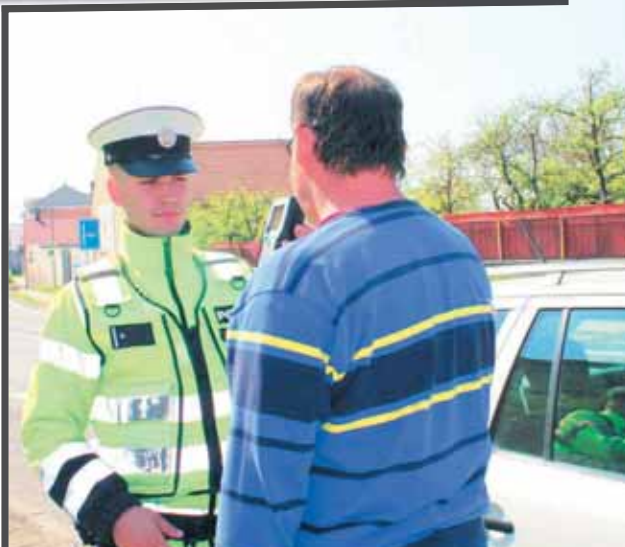
Policisté se zaměřili na alkohol, rychlosti i technický stav.

„Od 3. do 6. dubna 2026 jsme v Olomouckém kraji zkontrolovali 4220 vozidel. Přitom jsme zjistili 525 dopravních přestupků a na pokutách jsme vybrali 432 tisíc korun. Maximální povolenou rychlost překročilo 131 motoristů. V 92 případech jsme řešili špatný technický stav vozidel, 21 řidičů jelo po dálnici bez zaplacené dálniční známky a 8 jich při jízdě nepoužilo bezpečnostní pás. Za volantem jsme přistihli 6 řidičů pod vlivem alkoholu a 10 pod vlivem jiné návykové látky,“ informoval policejní mluvčí Libor Hejtmán. Při kontrolách policisté narazili i na 14 řidičů, kteří neměli uhrazené pokuty za dřívější dopravní přestupky a na místě od nich vybrali bezmála 40 tisíc korun. „Od pátku do pondělí jsme v Olomouckém kraji šetřili 39 dopravních nehod, což bylo o 3 více než v loňském roce. Při nehodách bylo zraněno 15 osob, všechny lehce. Nikdo při nehodě nezemřel,“ dodal Hejtmán.