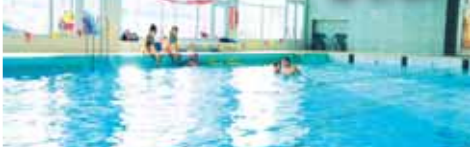
Lázně jsou vytíženy po celý týden.