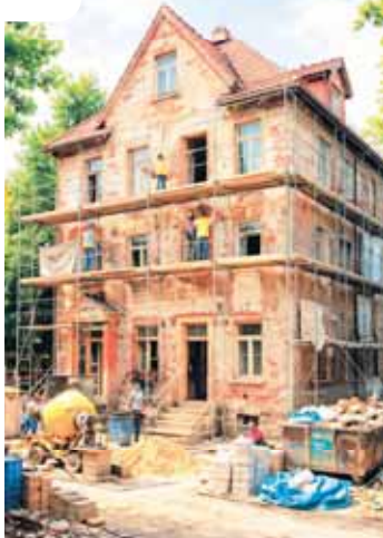
Kompletní renovace staršího domu se neobejde bez důkladného plánování.

Zjistěte, zda vaše úpravy vyžadují povolení. Zásahy do nosných konstrukcí, změny vzhledu stavby či dispozice obvykle vyžadují úřední povolení. Pokud rekonstruujete byt, musíte úpravy nahlásit SVJ nebo bytovému družstvu. Ověřte si také, zda se nemovitost nenachází v památkové zóně, což omezuje výběr materiálů a vzhled.