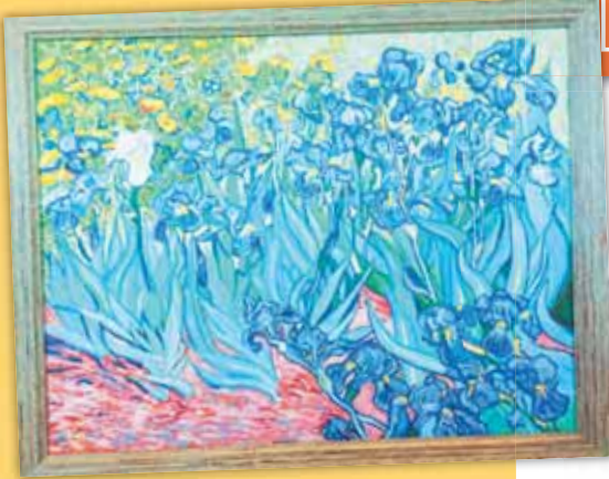
Originál tohoto vrcholného díla Vincenta van Gogha byl v roce 1987 vydražen za tehdy rekordní sumu 53,9 milionu dolarů. Jeho replika je nyní k vidění na plumlovském zámku.